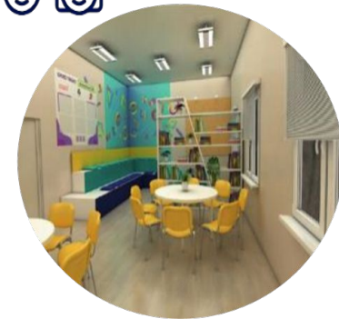
ЦЕНТРЫ ДЕТСКИХ ИНИЦИАТИВ