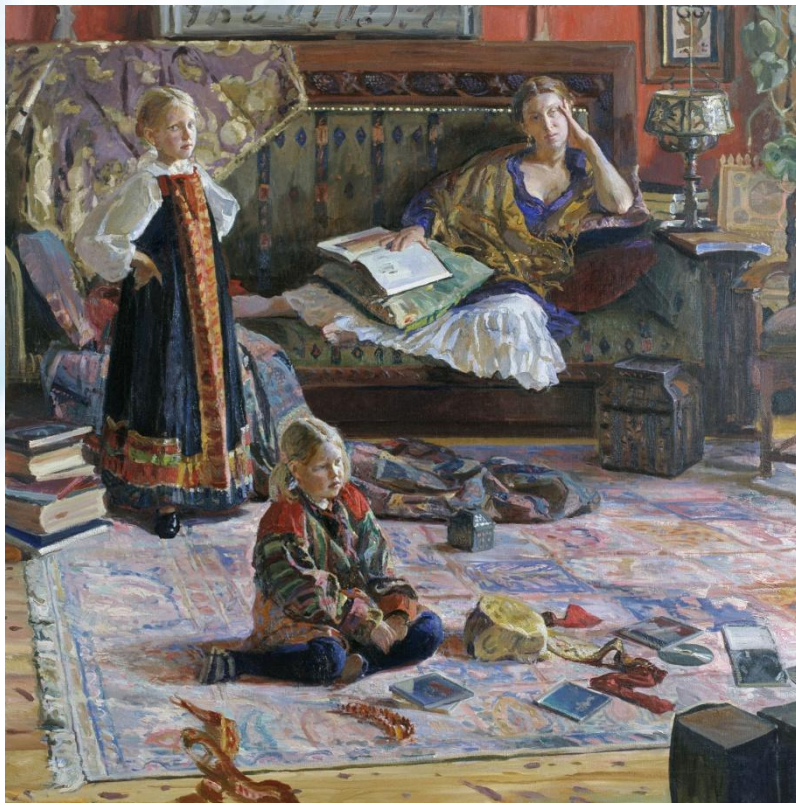
Иван Глазунов. Семья художника.

Семья — это группа людей, основанная на кровном родстве или заключении брака. Это маленькая группа члены которой связаны общностью быта (установившегося порядка повседневной жизни), взаимной помощью, получением сексуальных удовольствий (для мужа и жены), рождением и воспитанием детей.