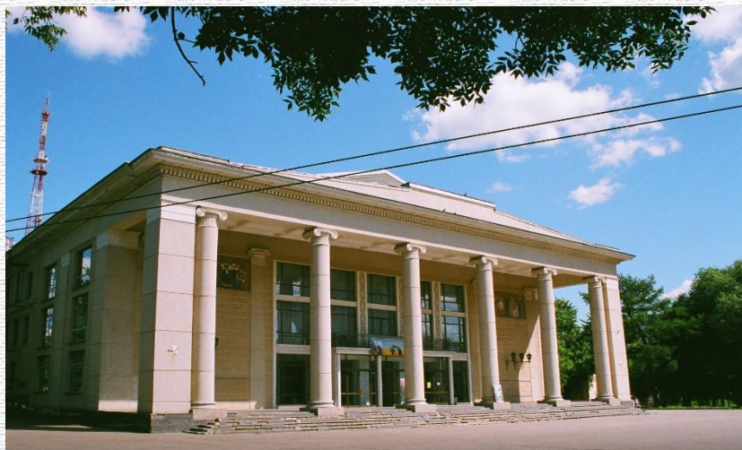
Здание Кировской филармонии