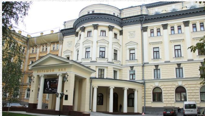
Здание Московской консерватории им. П.И. Чайковского

1961-1965 годы – учеба в Московской консерватории им. П.И. Чайковского на дирижерско-хоровом факультете .