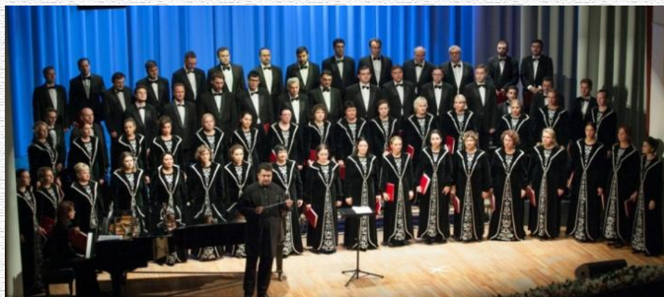
Государственный академический хор им. А.В. Свешникова