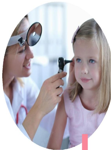
Право на охрану здоровья