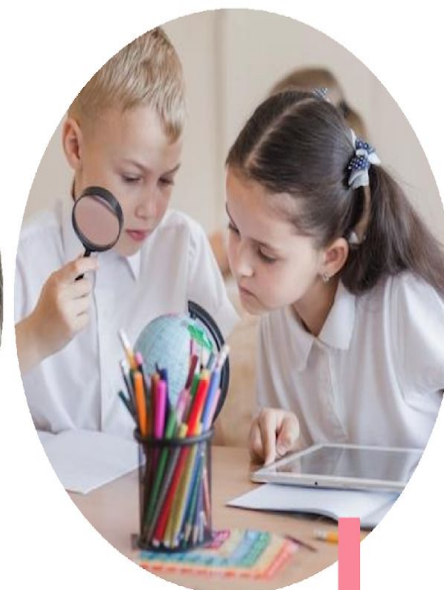
Право на образование