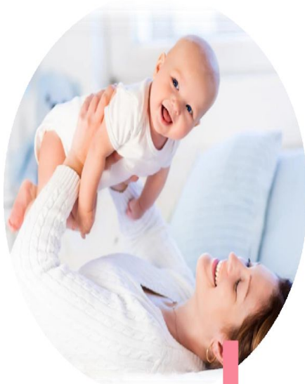
Право на жизнь

Конституция России закрепляет права и устанавливает обязанности граждан. Права человека — это высшая ценность, они защищают граждан, позволяют им учиться, работать, развиваться