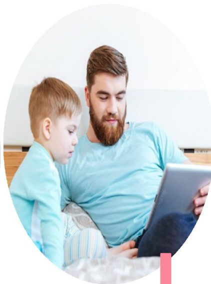
Право на жилище