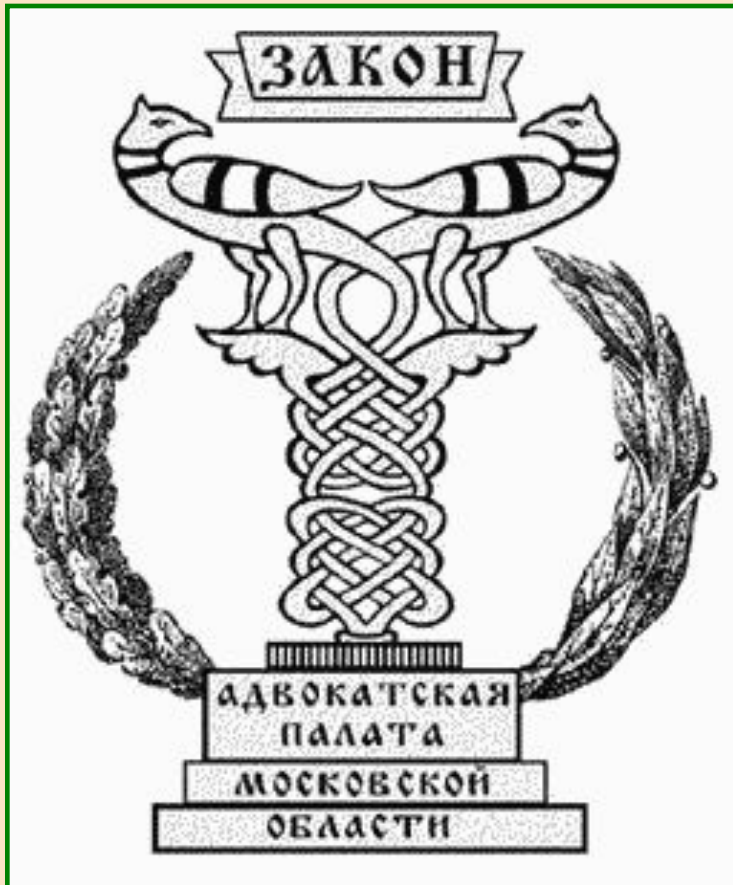
Эмблема адвокатуры Московской области

Иногда к правоохранительным органам относят адвокатуру и нотариат, оказывающих людям юридическую помощь.