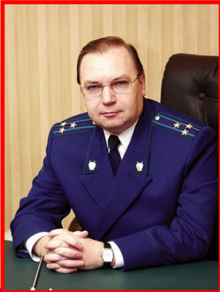
Эмблема прокуратуры РФ

Назначение правоохранительных органов – борьба с правонарушениями, пресечение противоправной деятельности.