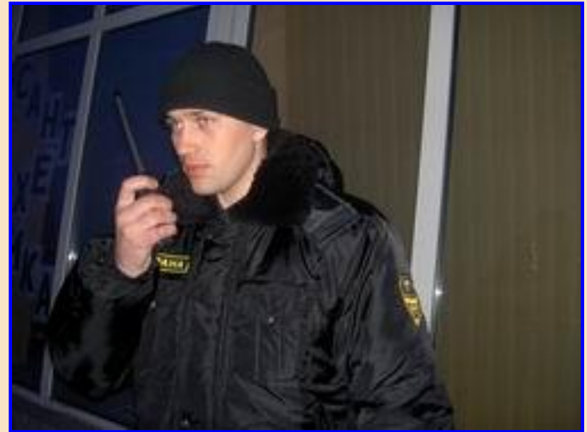
Сотрудник частного охранного предприятия (ЧОП)