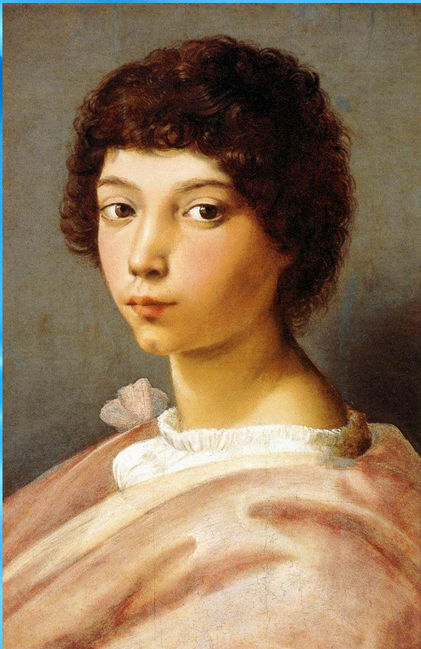
Портрет Рафаэля Санти в юности

Для Джованни Санти, даровитого художника, появление сына стало настоящим подарком. Когда его спросили, как назвать малыша, он будто бы воскликнул: «Конечно же, как ангела, — Рафаилом!» В итальянском варианте получилось — Рафаэль.