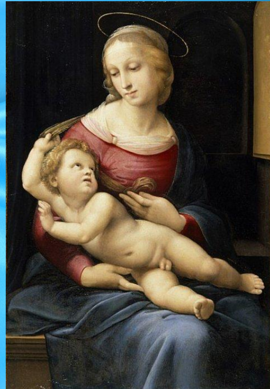
«Бриджуотерская мадонна» 1507 г.

Рафаэль виртуозно владел методом Леонардо да Винчи «сфумато». Очертания лиц как бы растворяются в плавных переходах от света к тени. Это делает фигуры объемными и живыми.