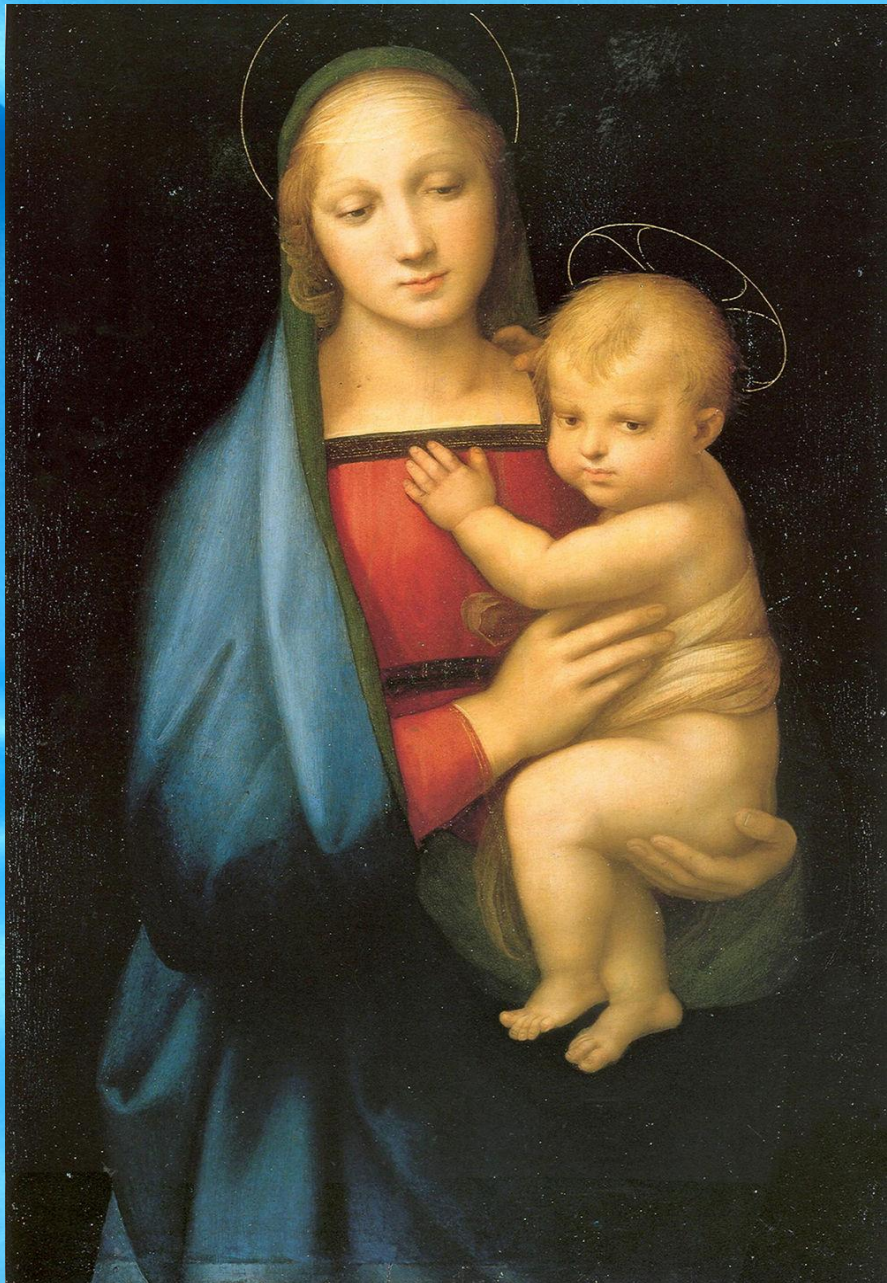
«Мадонна Грандука» 1505 г.