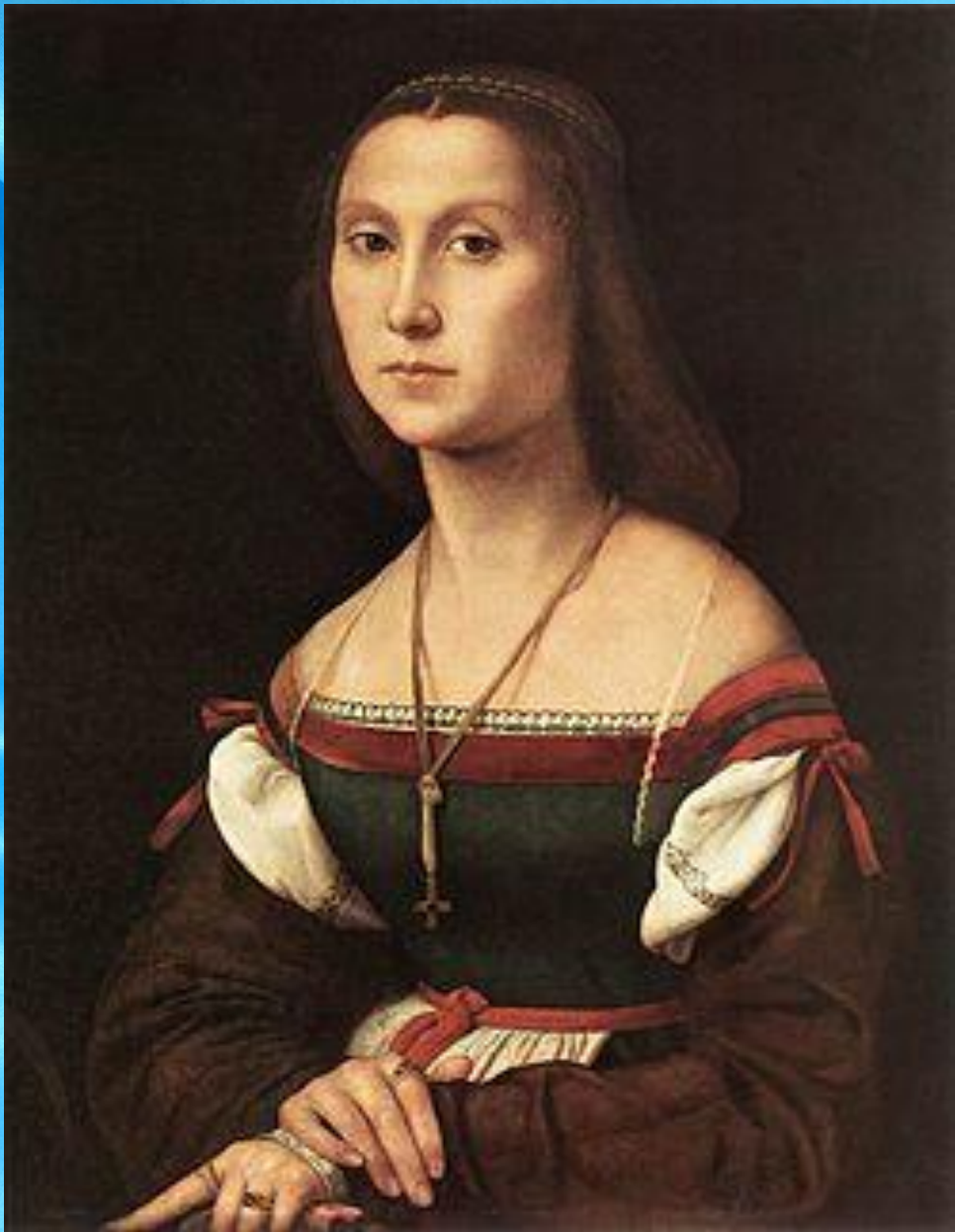
Немая. 1507 Рафаэль