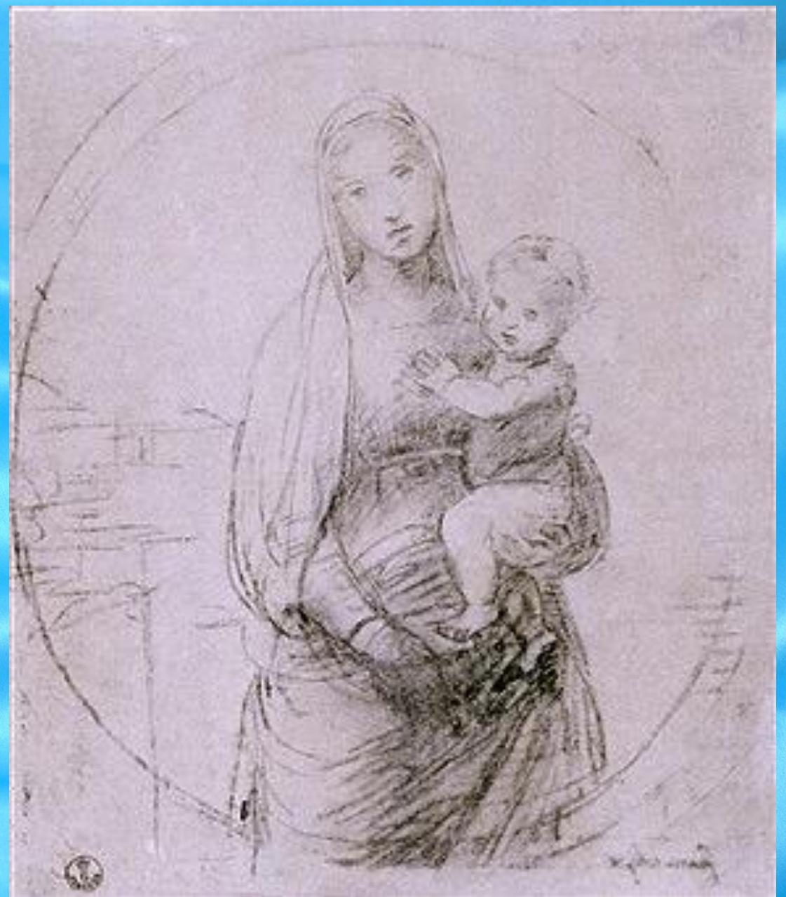
Эскиз «Мадонна Грандука»