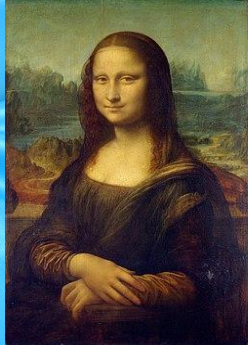
Мона Лиза между 1503 – 1505