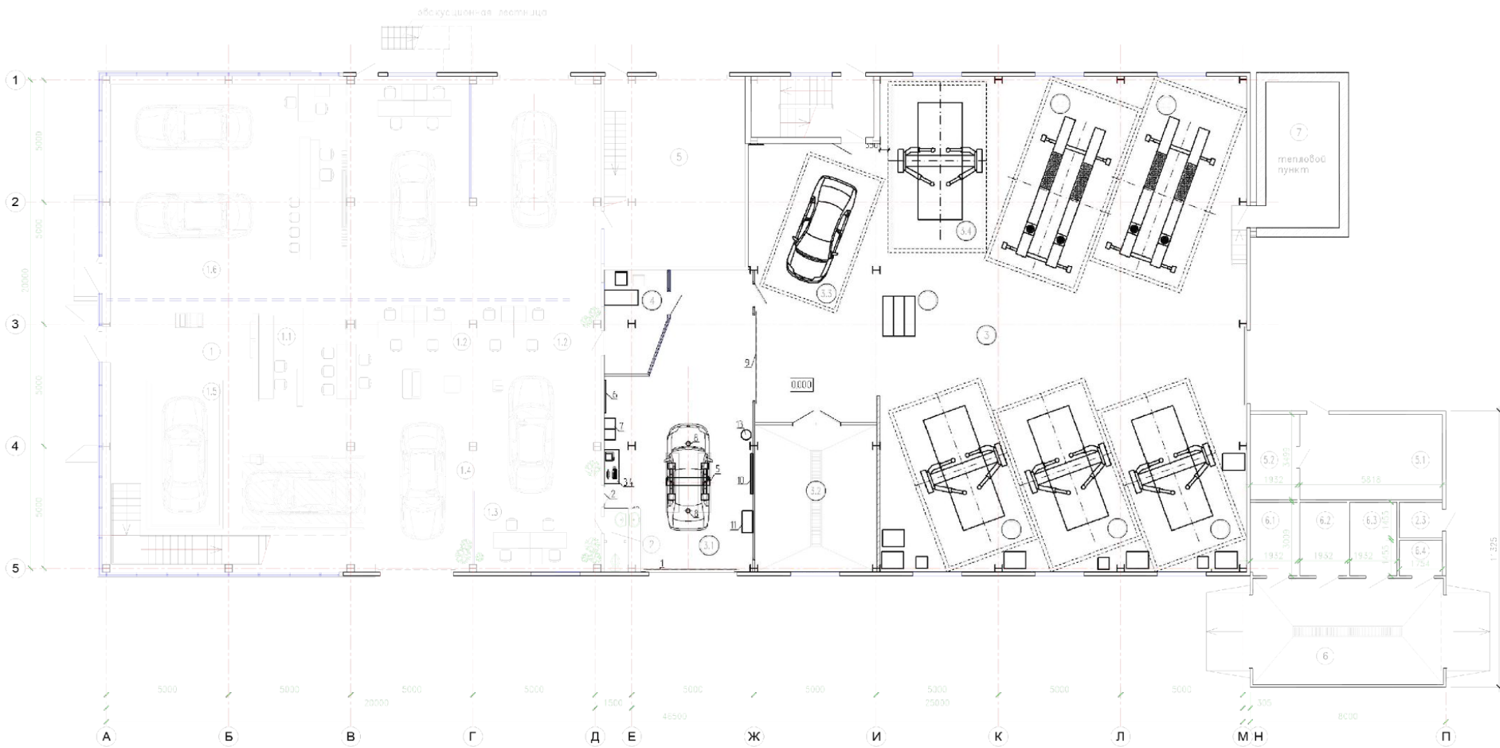
Экспликация помещений на отм. 0,000