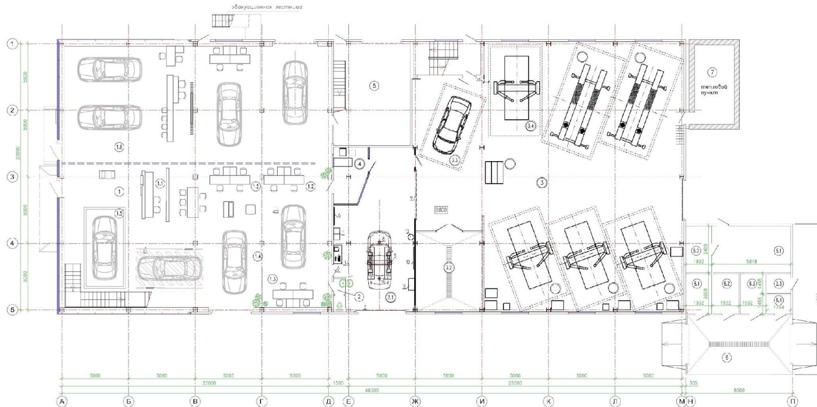
Экспликация помещений на отм. 0,000