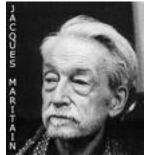
Жак Маритен (1882-1973)

Представители: Жак Маритен, Этьен Жильсон, Тейяр де Шарден