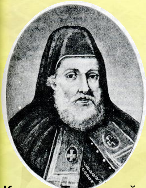
Кирилл Терлецкий Епископ луцкий