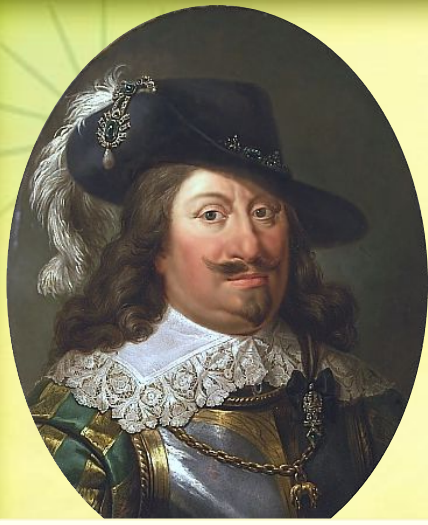
Владислав IV Ваза