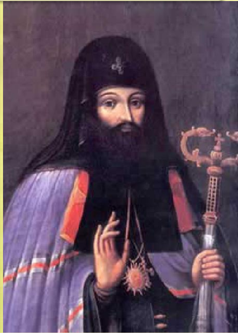
Киевский митрополит Пётр Могила