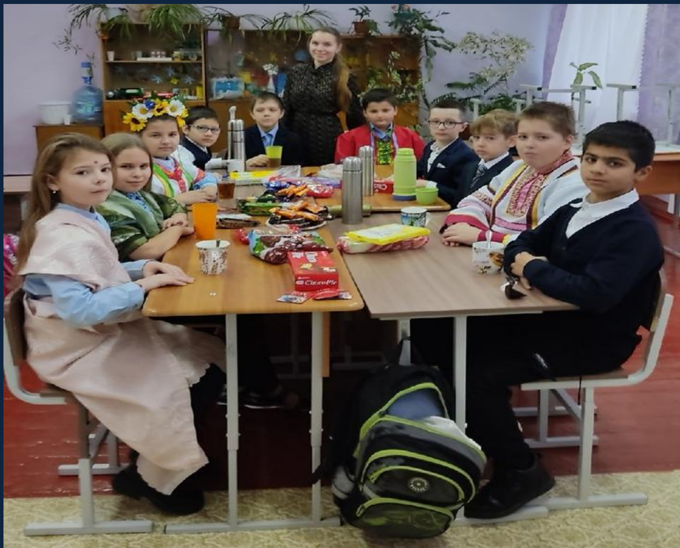
Русское чаепитие. МБОУ «Замостянская СОШ», г. Суджа