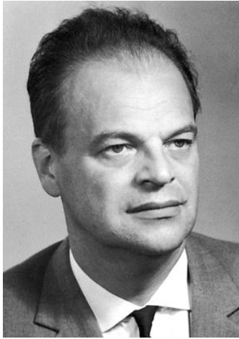
Nikolai Basov (1922-2001)

contributed to the development of the laser and maser