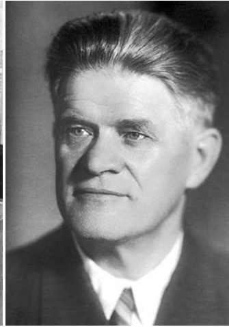
Pavel Cherenkov (1904-1990)

developed a quantitative chain chemical reaction theory (the only Soviet Chemistry Nobel Laureate)