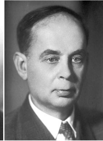
Ilya Frank (1908-1990)