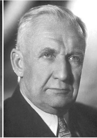
Igor Tamm (1895-1971)