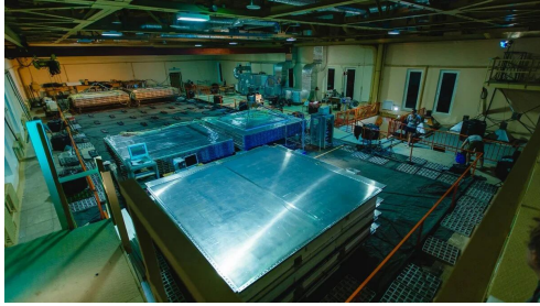
Neutrino Water Detector