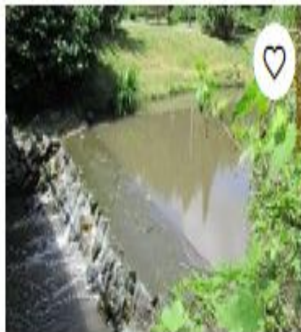
Парк фабрики Конти