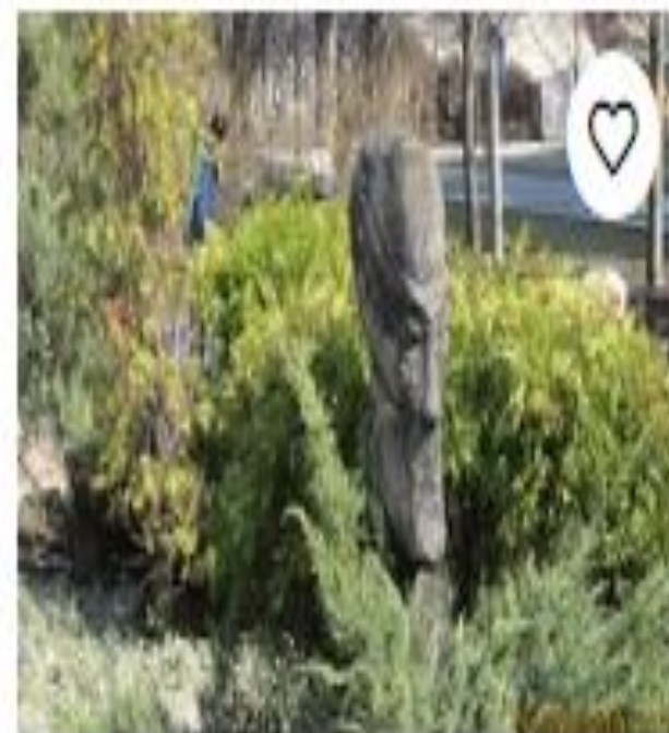
Парк скульптур "Укр..."