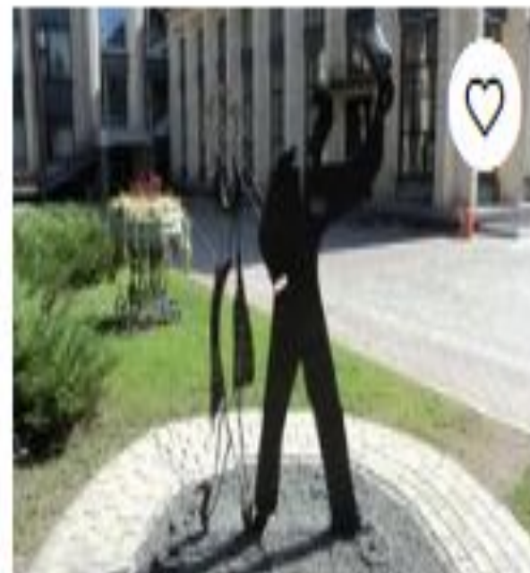
Парк кованых фигур