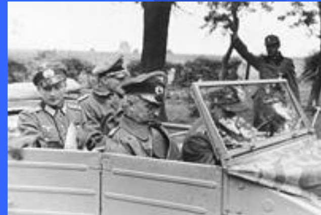
Командующий группой армий «Центр» фельдмаршал В. Модель (рядом с водителем).