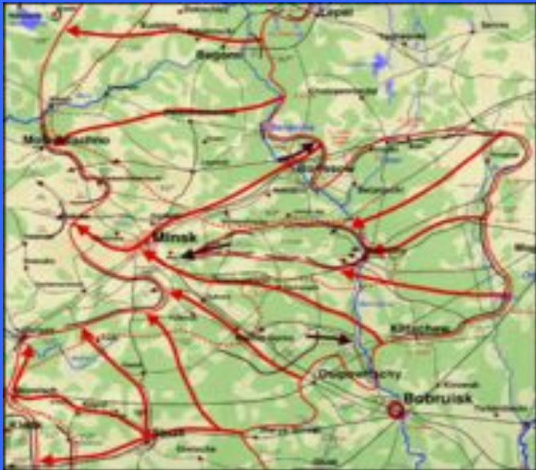
Создание котла под Минском

После крушения северного и южного флангов под Витебском и Бобруйском, фашисты оказались зажаты в своего рода прямоугольнике. Восточную «стену» этого прямоугольника образовывала река Друть, западную - Березина, северную и южную - советские войска. К западу находился Минск, на который были нацелены основные советские удары. Фланги 4-й армии фактически не были прикрыты. Окружение выглядело неминуемым. Поэтому немцы решили отступать через Березину к Минску. Единственным путем для этого оставалась грунтовая дорога от Могилёва через Березино. Скопившиеся на дороге войска и тыловые учреждения пытались по единственному мосту перебраться на западный берег Березины под постоянными уничтожающими ударами штурмовиков и бомбардировщиков. Кроме того, отступающие подвергались атакам партизан. Дополнительно ситуация осложнялась тем, что к отступающим присоединялись многочисленные группы солдат из частей, разбитых на других участках, даже из-под Витебска. По этим причинам переход через Березину шёл медленно и сопровождался большими жертвами.