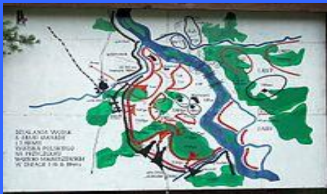
Сражение за Магнушевский плацдарм

8-я гвардейская армия основными силами занимала оборону на Магнушевском плацдарме, а ещё две дивизии были сосредоточены на восточном берегу в районе Гарволина из-за опасения К. К. Рокоссовского по поводу возможных немецких контрударов. Однако удары немецкой 19-й танковой дивизии и дивизии «Герман Геринг», выведенных из-под Радзимины, обрушились не в тыл плацдарма, а на его фронт, на его южную часть. Утром 8 августа удалось навести мосты через реку, благодаря зенитному «зонтику», который повесили новоприбывшие три зенитные дивизии. Воспользовавшись мостами, на плацдарм переправился 8-й гвардейский танковый корпус, изъятый из 2-й танковой армии. Этот момент стал переломным в борьбе за Магнушевский плацдарм, в последующие дни активность противника упала. Не помогло и введение «свежей» 25-й танковой дивизии. Затем прибыл 16-й танковый корпус 2-й танковой армии. К 16 августа противник прекратил атаки. Плацдарм был удержан. На Пулавском плацдарме 2 августа 69-я армия при поддержке Войска Польского объединила два небольших плацдарма у Пулавы в единый, 24 км по фронту и 8 в глубину. С 5 по 14 августа немцы пытались уничтожить плацдарм, но потерпели неудачу. После этого армия В. Я. Колпакчи окончательно консолидировала плацдармы, к 28 августа создав предмостное укрепление 30 на 10 км. 29 августа фронт перешёл к обороне, хотя правое крыло фронта ещё продолжало частные операции. С этой даты операция «Багратион» считается оконченной.