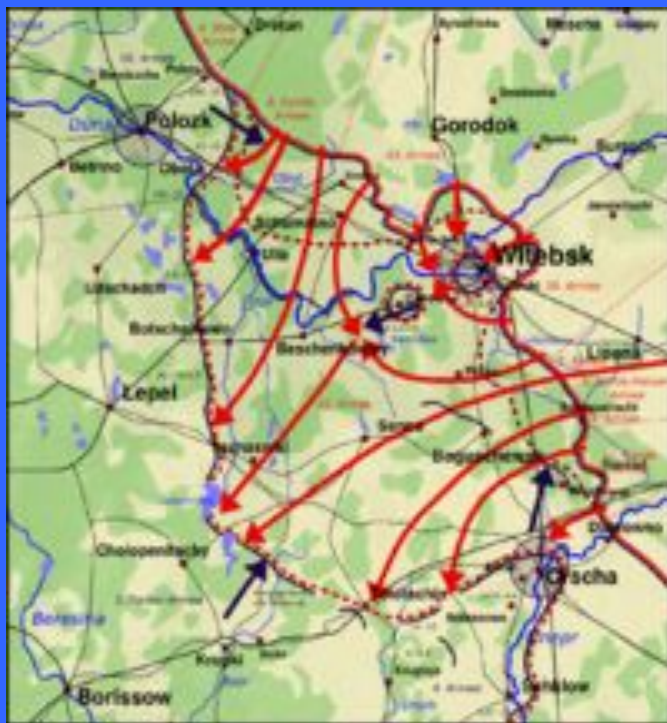
Сражение вокруг Витебска

Если «Белорусский балкон» в целом выдавался на восток, то район города Витебск был «выступом на выступе», выдаваясь ещё дальше с северной части «балкона». Город был объявлен «крепостью», аналогичный статус имела находящаяся южнее Орша. Операцию проводили два фронта. 1-й Прибалтийский фронт действовал на северном фланге будущей операции. Его задача состояла в том, чтобы окружить Витебск с запада и развивать наступление дальше на юго-запад к Лепелю. 3-й Белорусский фронт действовал южнее. Задача этого фронта заключалась в том, чтобы во-первых, создать южную «клешню» окружения вокруг Витебска, во-вторых, самостоятельно охватить и взять Оршу. В итоге фронт должен был выйти в район города Борисов. Для действий в глубине 3-й Белорусский фронт располагал конно-механизированной группой и 5-й гвардейской танковой армией П. А. Ротмистрова.