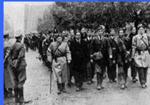
Капитуляция повстанцев в Варшаве.