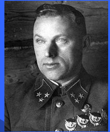
Константин Рокоссовский, командующий 1-м Белорусским фронтом.

Советский солдат осматривает подбитые танки Pz-4 20-й танковой дивизии в окрестностях Бобруйска. Тела на переднем плане свидетельствуют о мрачной судьбе экипажей.