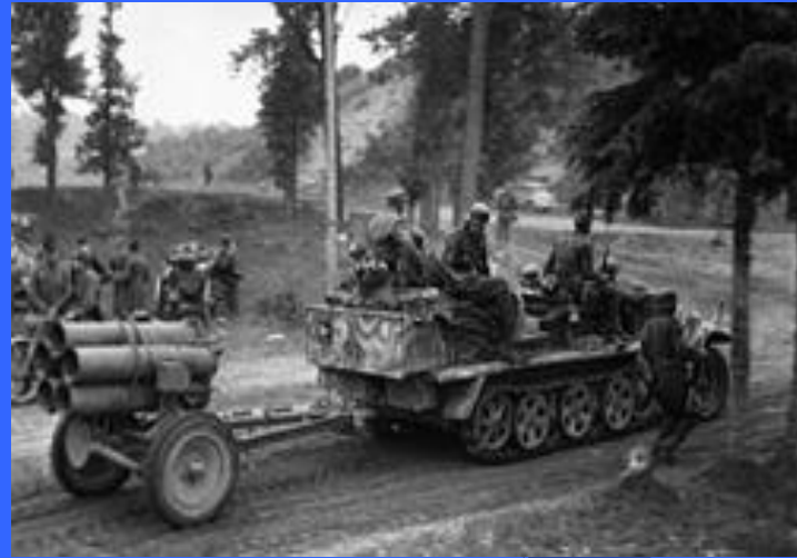
Отступление из-под Орши. В кадре полугусеничный тягач SdKfz 10 с реактивным миномётом Nebelwerfer 42 на прицепе