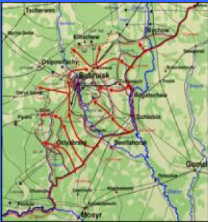
Бобруйское сражение до 27 июня.