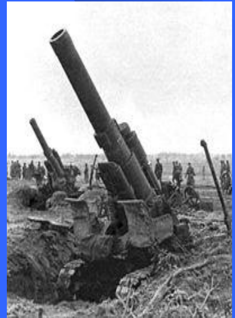
Батарея тяжёлых гаубиц Б-4. 3-й Белорусский фронт.