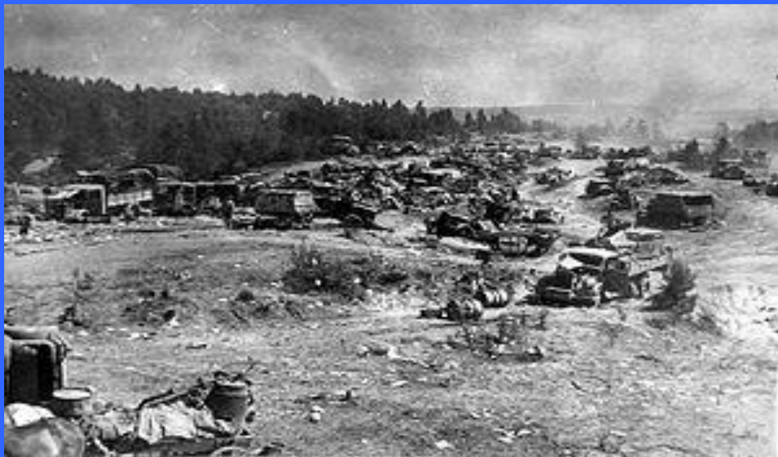
Колонна 9-й немецкой армии, разгромленная ударом с воздуха неподалеку от Бобруйска.

В то же время, к концу весны 1944 года наступление на юге замедлилось, и Ставкой Верховного Главнокомандования было принято решение изменить направление усилий. Как отметил К. К. Рокоссовский: «К весне 1944 года наши войска на Украине продвинулись далеко вперёд. Но тут противник перебросил с запада свежие силы и остановил наступление 1-го Украинского фронта. Бои приняли затяжной характер, и это заставило Генеральный штаб и Ставку перенести главные усилия на новое направление».