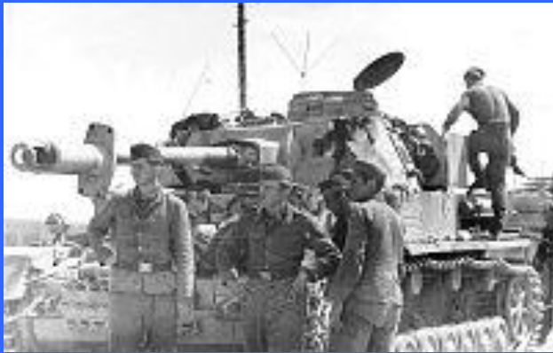
Серьезно поврежденный немецкий танк.

Конно-механизированная группа И. А. Плиева уже ко 2 июля овладела Несвижем, перерезав минской группировке пути отхода на юго-восток. Наступление развивалось быстро, сопротивление оказывали только мелкие разрозненные группы солдат. 2 июля остатки 12-й танковой дивизии немцев были отброшены от Пуховичей. Ко 2 июля танковые корпуса фронта К. К. Рокоссовского подошли к Минску.