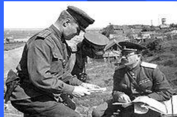
Командующий 5-й гвардейской танковой армией П. А. Ротмистров на командном пункте