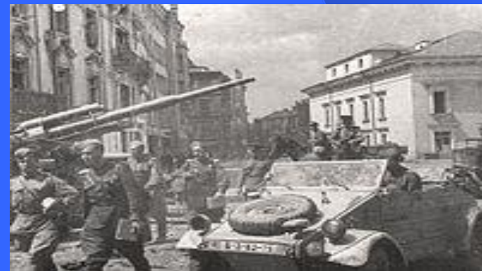
Советские солдаты в Вильнюсе.