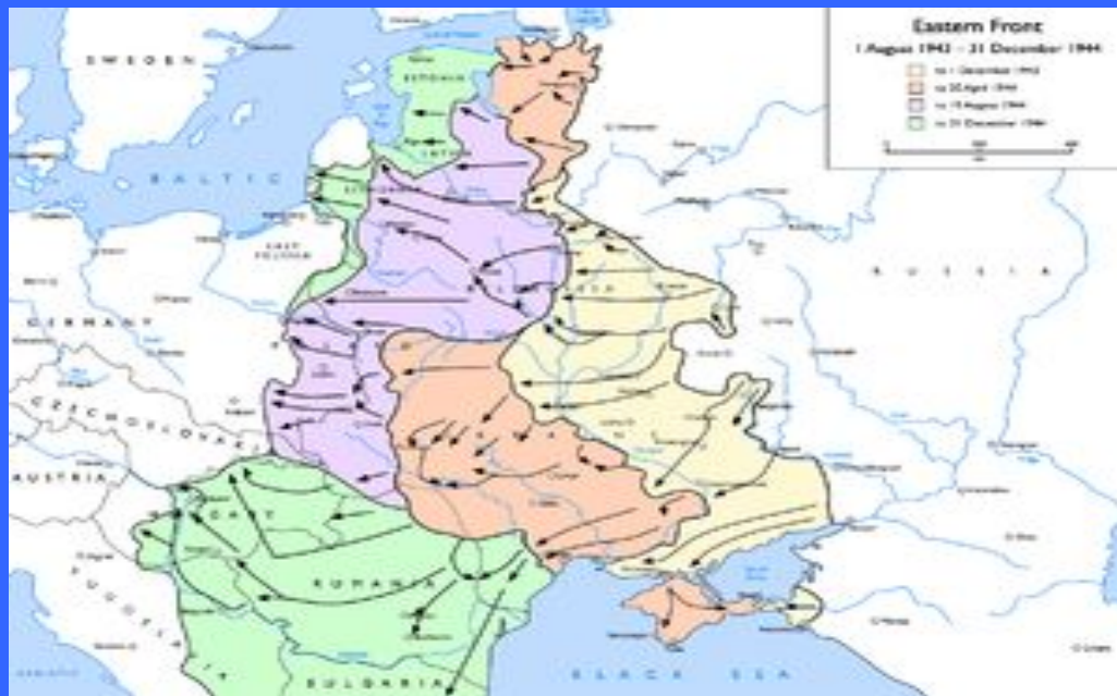
Советско-германский фронт с августа 1943 года по декабрь 1944 года.