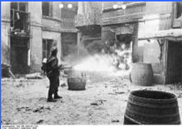
Немецкий солдат стреляет из огнемёта во время Варшавского восстания.