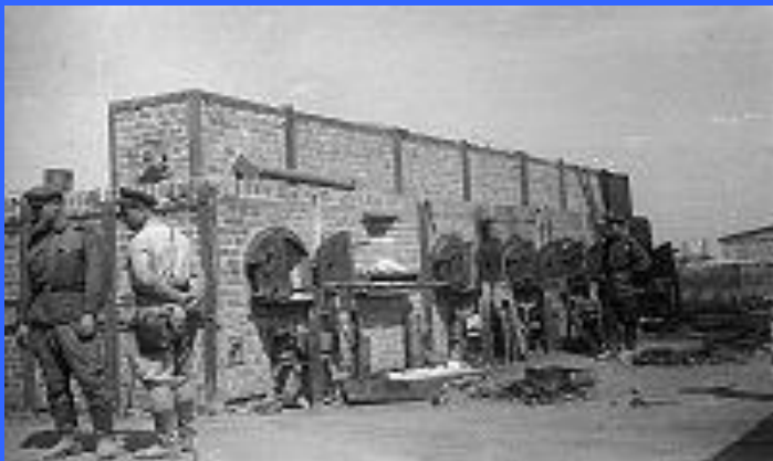
Советские военнослужащие в ликвидированном концлагере Майданек

В это время на правом крыле фронта был освобожден Кобрин. Таким образом, под Брестом начал формироваться локальный «котел». 25 июля кольцо окружения вокруг частей 86-й, 137-й и 261-й немецких пехотных дивизий было замкнуто. Через три дня, 28 июля, остатки окруженной группы прорвались из «котла». При разгроме брестской группы немцы понесли серьёзные потери убитыми, что отмечается обеими воюющими сторонами. Пленных было взято чрезвычайно мало - всего 110 человек. Тем временем 2-я танковая армия наступала на Люблин. Армия получила приказ 21 июля, и в ночь на 22-е приступила к его выполнению и после скоротечного боя пробил немецкую оборону. Во второй половине дня начался охват Люблина. Шоссе Люблин -Пулавы было перекрыто, на дороге были перехвачены тыловые учреждения противника. Наутро 23 июля был предпринят штурм города силами танковых корпусов. В предместьях советские силы имели успех, но удар в сторону площади Локетка был парирован. Проблемой штурмующих был острый недостаток мотопехоты. Эта проблема была смягчена: в городе вспыхнуло восстание Армии Крайовы. Рано утром 24 июля часть гарнизона покинула Люблин, однако не всем удалось успешно отступить. Перед полуднем в центре города соединились штурмующие его с разных сторон части, и к утру 25 июля Люблин был очищен. После взятия Люблина, 2-я танковая армия совершила глубокий рывок к северу вдоль Вислы, имея конечной целью захват Праги, восточного предместья Варшавы. Вблизи Люблина был освобожден лагерь смерти Майданек.