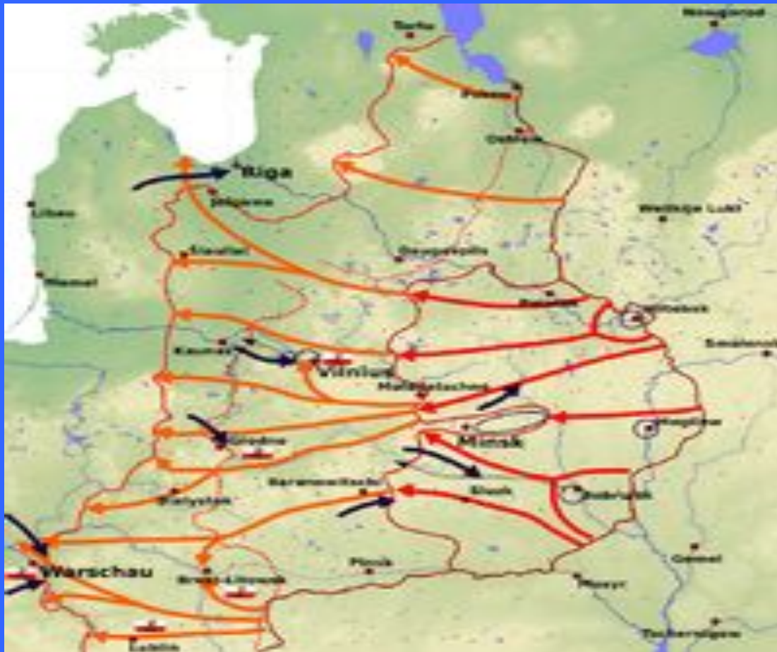
Общая схема операции «Багратион». Красные стрелы демонстрируют удары советских войск до 4 июля

В ходе этого обширного наступления была освобождена территория Белоруссии, восточной Польши и часть Прибалтики и практически полностью разгромлена германская группа армий «Центр». Вермахт понёс тяжелейшие потери, отчасти из-за того, что А. Гитлер запрещал любое отступление. Восполнить эти потери впоследствии Германия была уже не в состоянии.