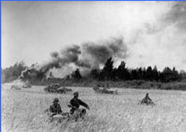
Солдаты дивизии «Великая Германия» во время отступления из Шяуляя.

Наступая, 1-й танковый корпус перерезал железную дорогу Вильнюс - Двинск. К 14 июля левый фланг продвинулся на 140 км, оставляя южнее Вильнюс и двигаясь на Каунас. 27 июля Двинск был очищен от фашистов. Советские войска продолжили движение к Шяуляю. Шяуляй был взят уже 27 июля.