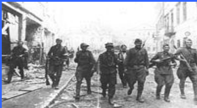
Совместный патруль Красной Армии и Армии Крайовой в Вильнюсе.