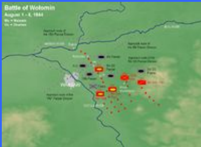
Схема столкновения под Радзимином 1-4 августа. XXX - корпус, XX - дивизия. Хорошо виден прорыв 3-го танкового корпуса в обход Варшавы и перехват его коммуникаций у Воломина и Радзимины.

Люблин-Брестская операция поставила под сомнение реальность планов Моделя по удержанию фронта вдоль Вислы. Парировать угрозу фельдмаршал мог при помощи резервов. 24 июля была воссоздана 9-я армия, ей были подчинены прибывающие на Вислу силы. Армия Радзиевского имела конечной целью захват плацдарма за Наревом (приток Вислы) к северу от Варшавы, в районе Сероцка. По дороге армия была должна захватить Прагу, пригород Варшавы на восточном берегу Вислы. После овладения районом Брест и Седлец правым крылом фронта развивать наступление в общем направлении на Варшаву с задачей не позже 5–8 августа овладеть Прагой и захватить плацдарм на западном берегу р. Нарев в районе Пултуск, Сероцк. После контрудара под Радзимином, 3-й танковый корпус был отведен к Минск-Мазовецкому для отдыха и пополнения, а 16-й и 8-й гв. танковые корпуса были переброшены на Магнушевский плацдарм. Их противниками там стали те же дивизии, «Герман Геринг» и 19-я танковая, что и под Радзимином.