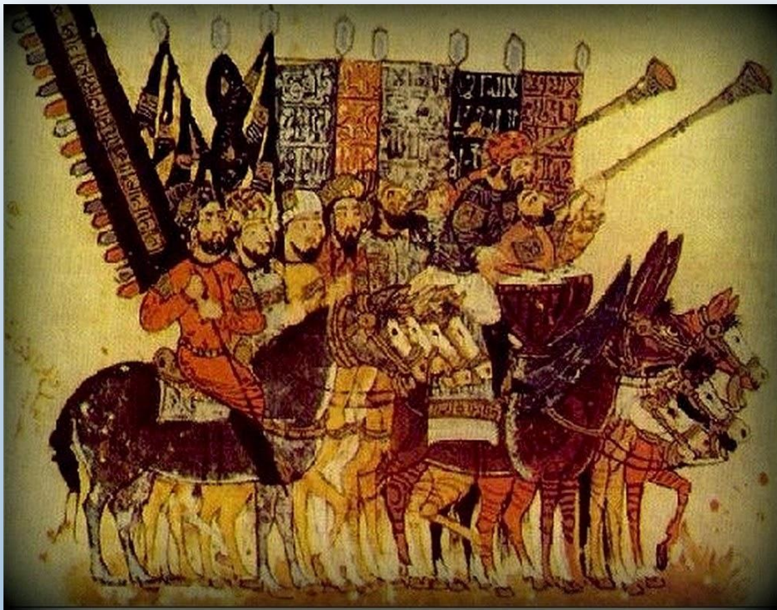
Полотно с изображением Шайбанидов