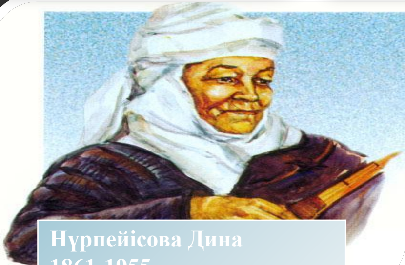
Нұрпейісова Дина 1861-1955