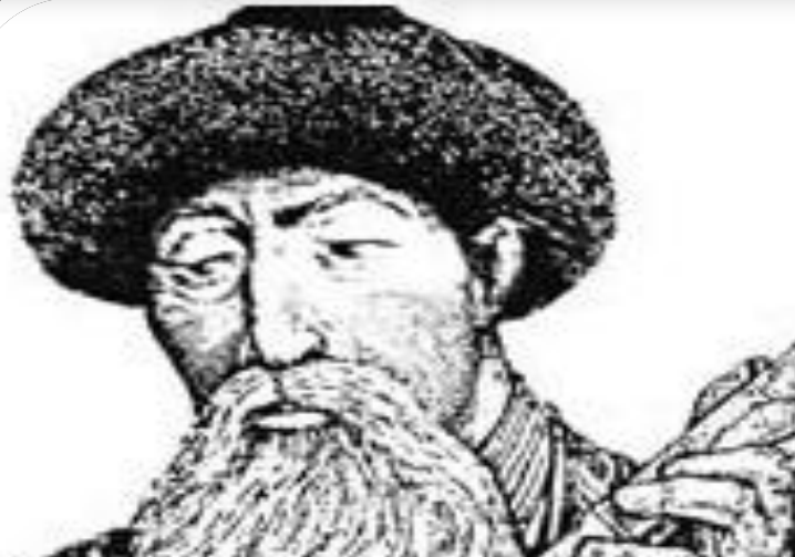
Қазанғап 1854– 1921