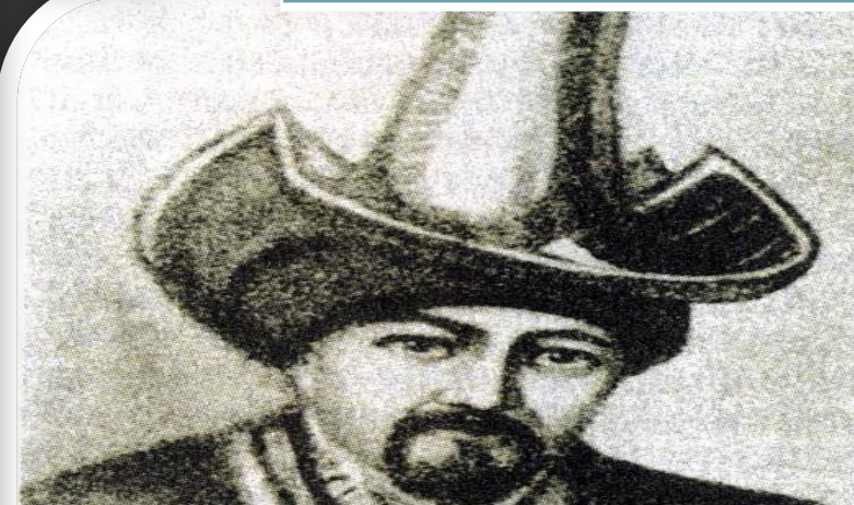
Дәулеткерей Шығайұлы 1820-1887