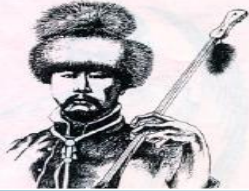
Тәттімбет Қазанғапұлы 1815-1862