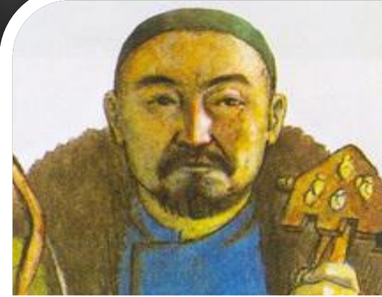
Ықылас Дүкенұлы 1843-1916