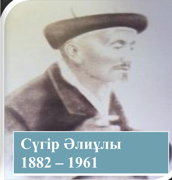
Сүгір Әлиұлы 1882 – 1961