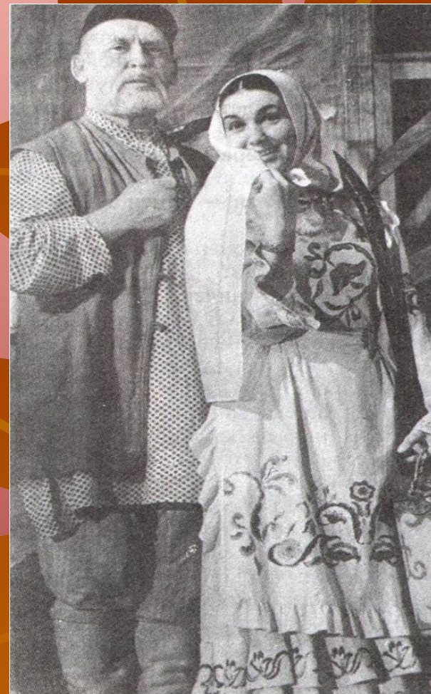
Т.Миңнуллинның киң танылган пьесасы “Әлдермештән Әлмәндәр”