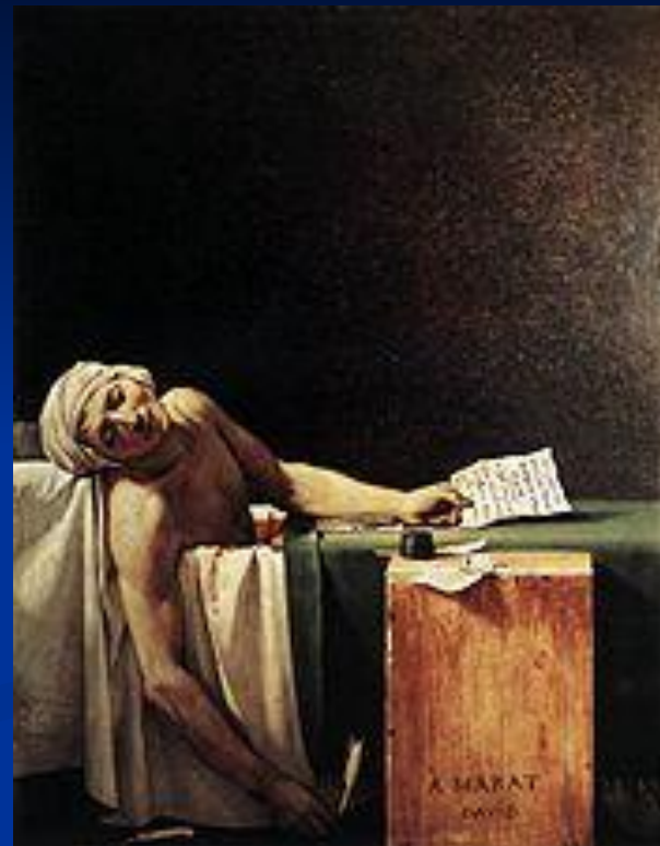
Смерть Марата Смерть Марата ( Жак Луи Давид Смерть Марата (Жак Луи Давид, 1793 )