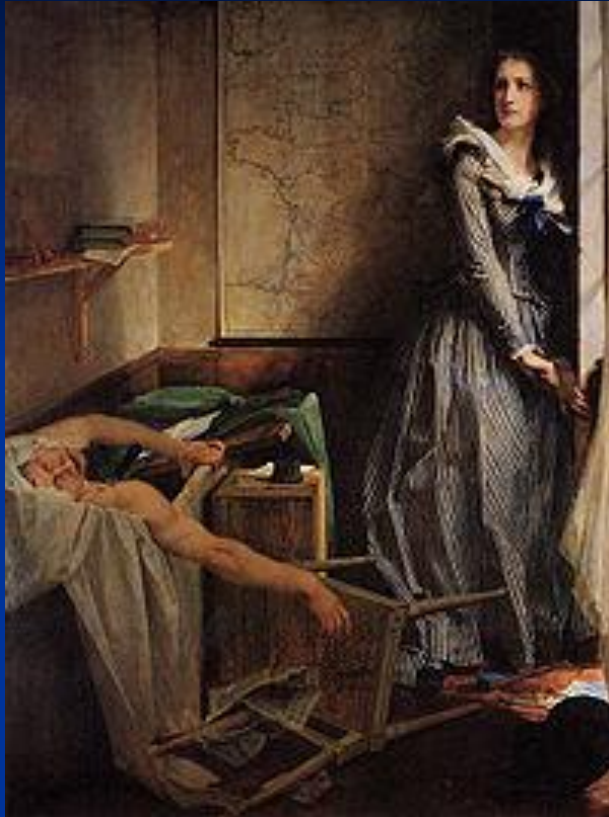
Смерть Марата (Жак Луи Давид, 1793)