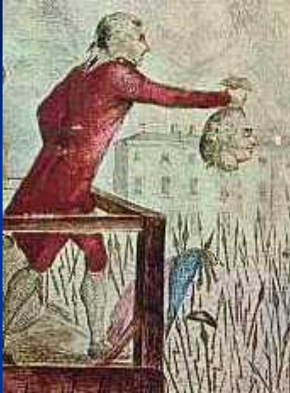
Отрубленная голова короля была показана народу