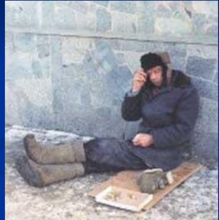
Права человека защищают человеческое достоинство от унижений и произвола власти

было не только поощрение идеалов Декларации, принципов справедливости и равенства для всех, а также напоминание того, что цель воплощения Декларации в реальность для всех и каждого пока еще остается не достигнутой.