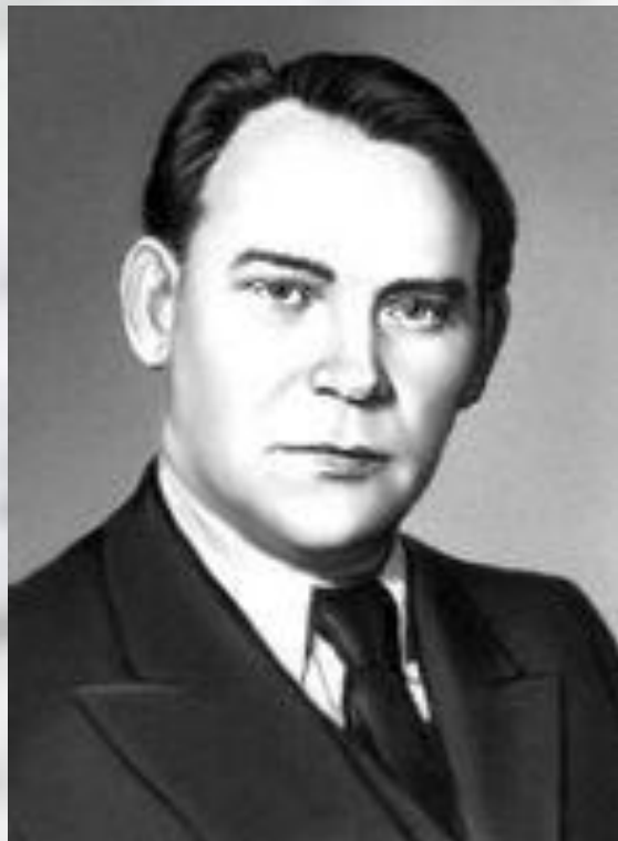
Музыка А. Г. Новикова