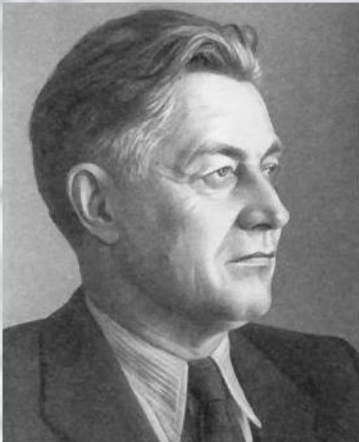
Слова А. А. Суркова