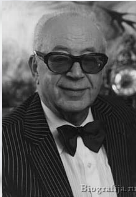
Музыка Н. Богословского