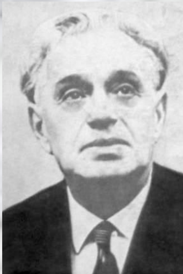
Музыка К. Листова