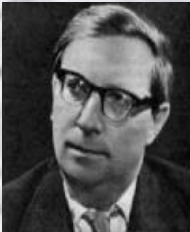
Слова Л. И. Ошанина