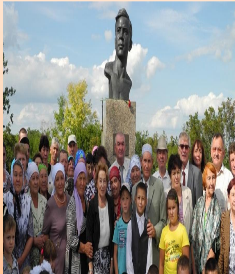
Оренбург, Мостафа авылы