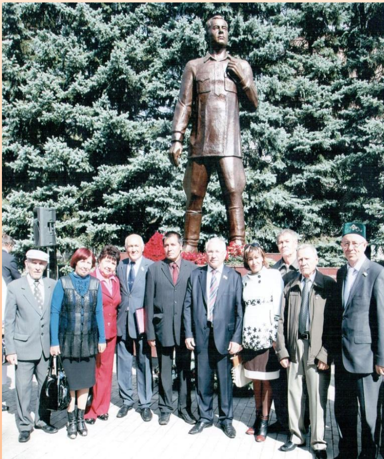
Түбән Кама шәһәрндә