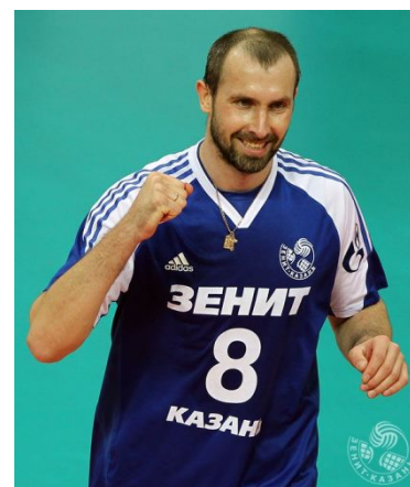
Сергей Тетюхин (Россия)