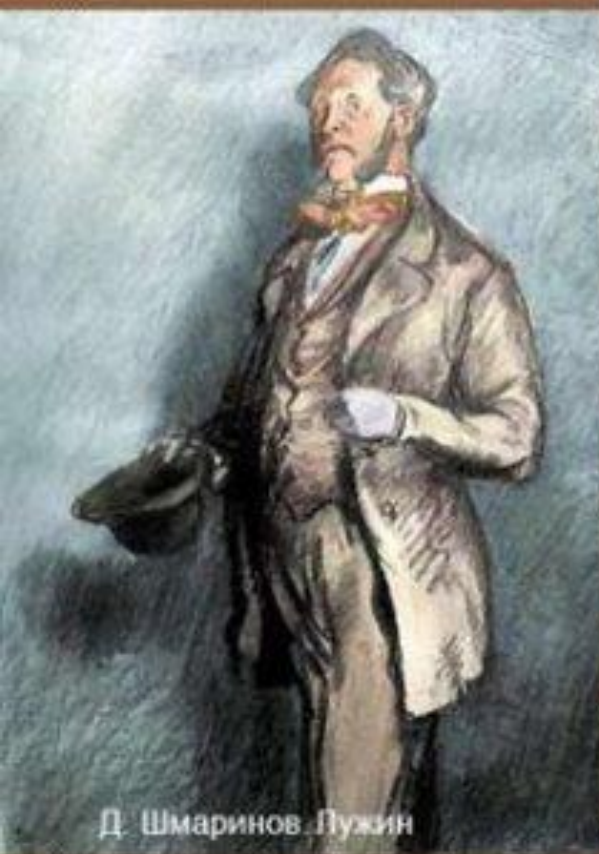
Д. Шмаринов. Лужин

Персонажи, в которых проявляются крайне негативные черты характера главного героя. Проекция теории Раскольникова на жизненные позиции, сниженные и опошленные варианты теории.