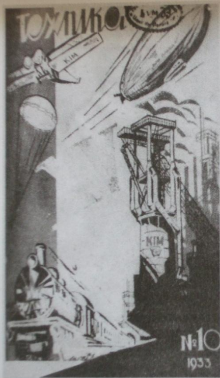
А.Алиш 1933–1936 елларда эшлэгән «Техника» журналының тышлығы