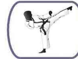
Les arts martiaux