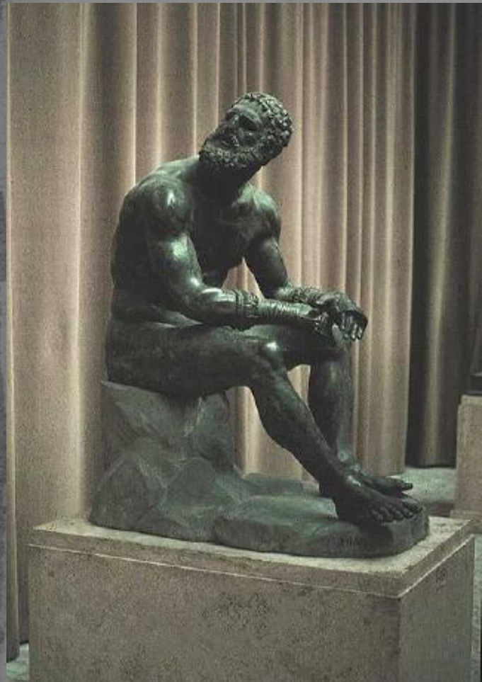
Бронзовая скульптура борца, победившего в Олимпийских играх.

В пятый заключительный день перед храмом Зевса ставили стол из золота и слоновой кости. На нём лежали награды.