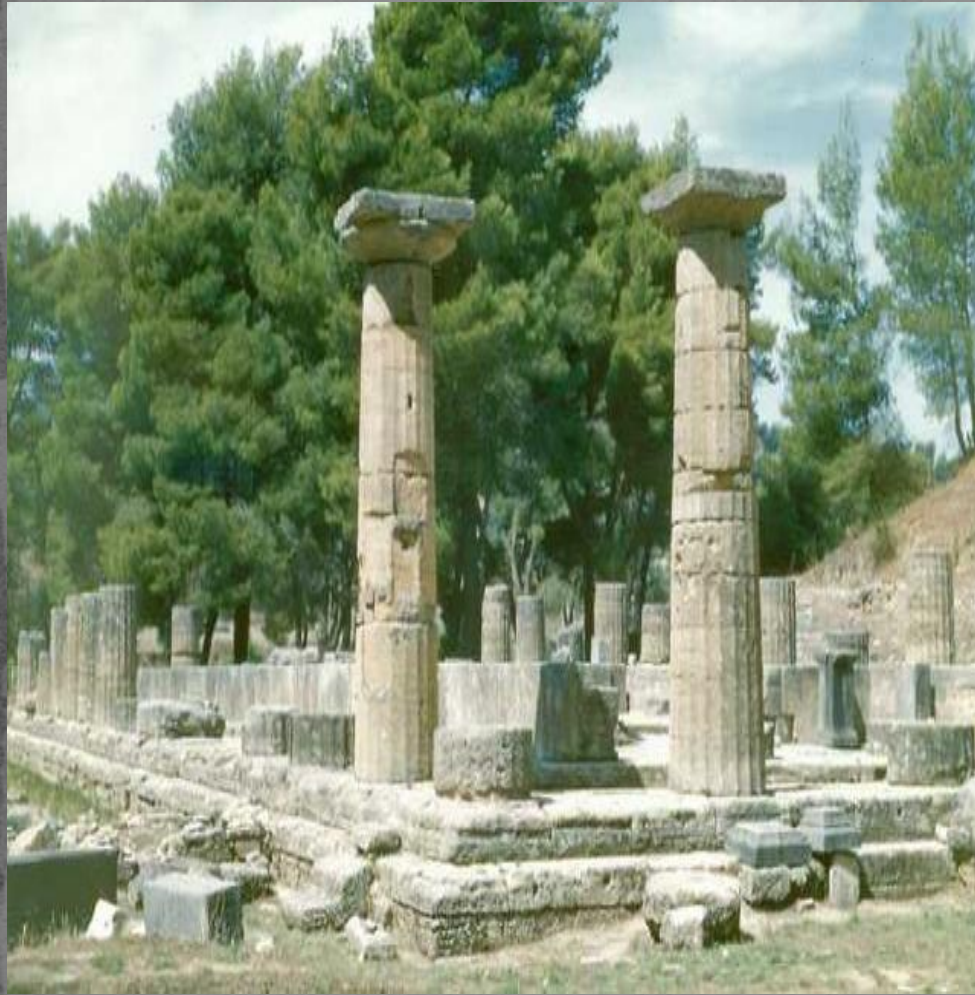
Олимпия. Место проведения Олимпийских игр.

В год Олимпийских игр глашатаи разносили по городам Эллады радостную весть: «Все – в Олимпию! Священный мир объявлен, дороги безопасны! Да победят сильнейшие!»