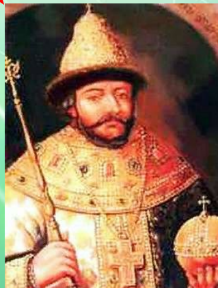
Федор – правил с 1584 по 1598 гг., умер бездетным