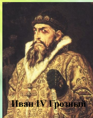
Иван IV Грозный