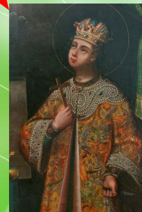
Дмитрий – погиб в 1591 году, в Угличе, 8 лет