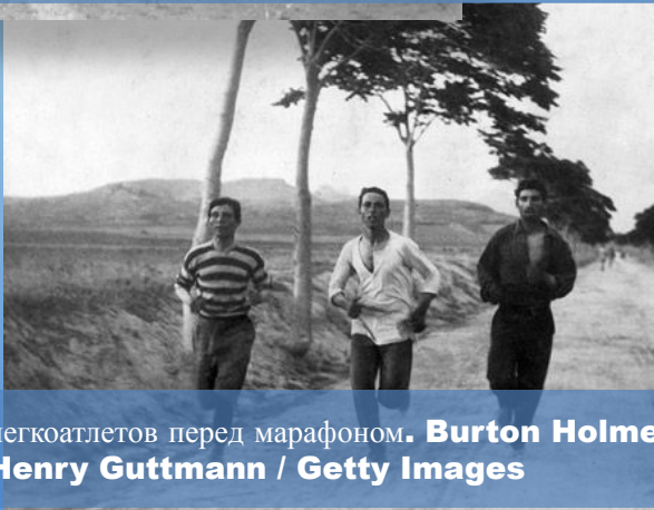
Тренировка легкоатлетов перед марафоном.

ОЛИМПИЙСКИЙ ДЕВИЗ состоит из трех латинских слов –« Citius, Altius, Fortius! », что в переводе - «Быстрее, выше, сильнее!». Фраза из трех слов впервые была сказана французским священником Анри Дидоном на открытии спортивных соревнований в своем колледже. Эти слова понравились Кубертену и он посчитал, что именно эти слова отражают цель атлетов всего мира.