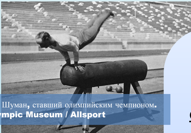
Немецкий гимнаст Карл Шуман, ставший олимпийским чемпионом.