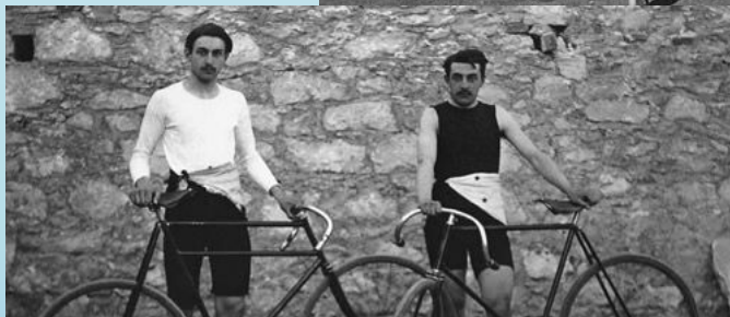
Французские велогонщики Леон Фламан и Поль Массон. Фламан завоевал золото гонке на 100 км , а Массон выиграл золотые медали на дистанциях 2 км и 10 км .