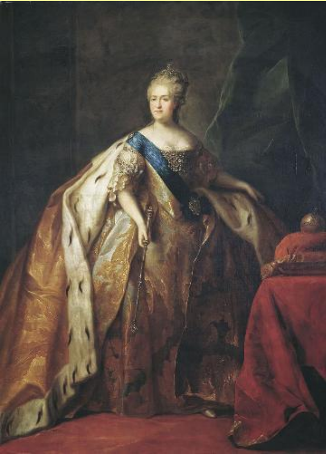
Портрет императрицы Екатерины II.