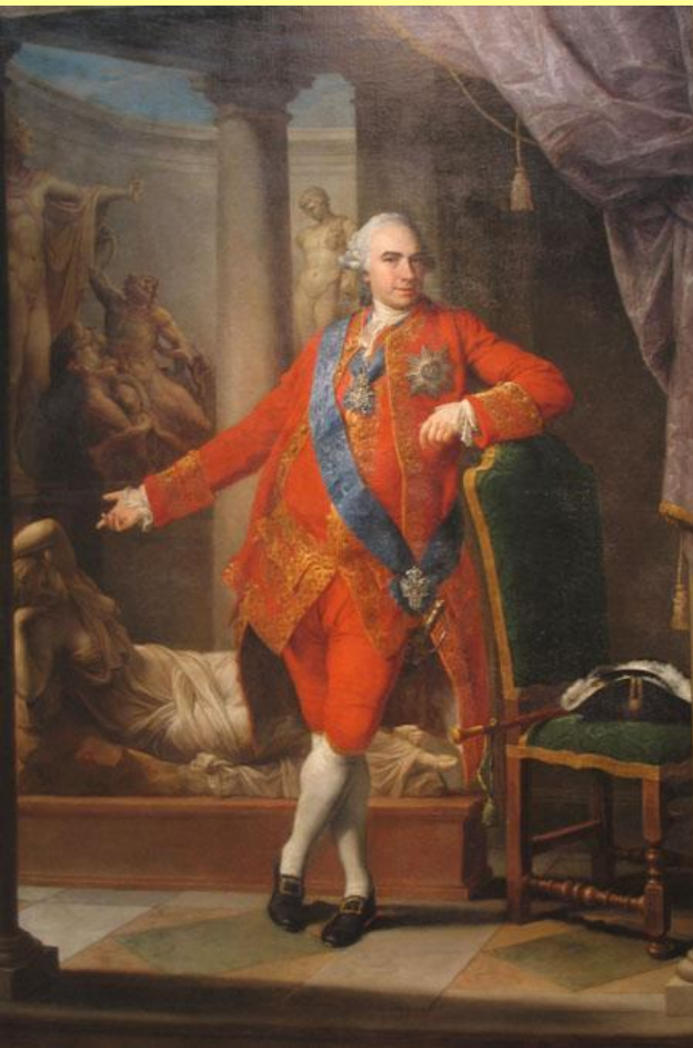
Портрет Кирилла Григорьевича Разумовского. Худ. Г.П. Батони. 1766 г.

В 1764 г. Екатерина приняла отставку последнего гетмана Украины К.Г. Разумовского.