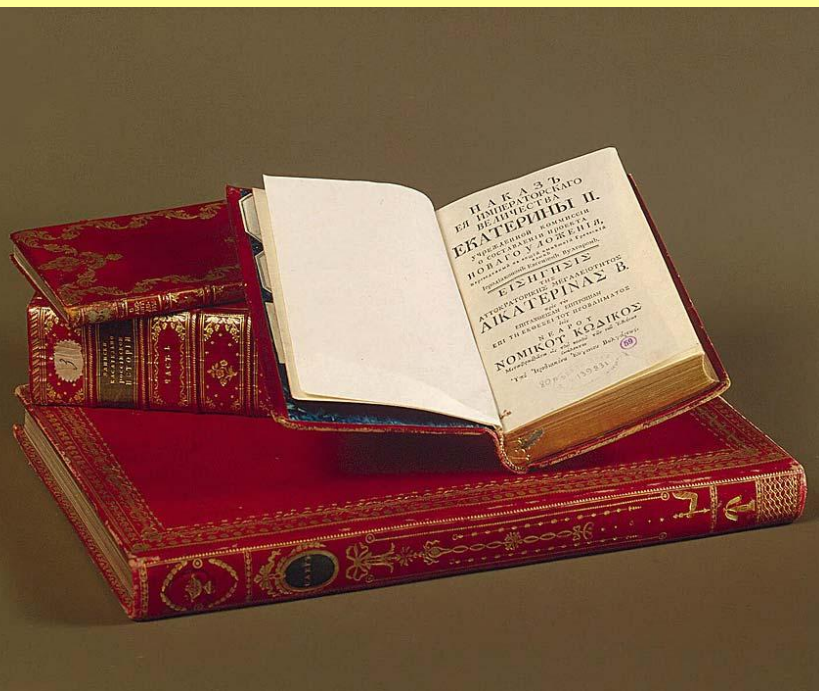
Книги из библиотеки Екатерины II. Собрание Гос. Эрмитажа.

«Для введения лучших законов необходимо потребно умы людские к тому приуготовить». «Государь есть самодержавный, ибо никакая другая, как только соединенная в его особе власть, не может действовать сходно с пространством толь великого государства».