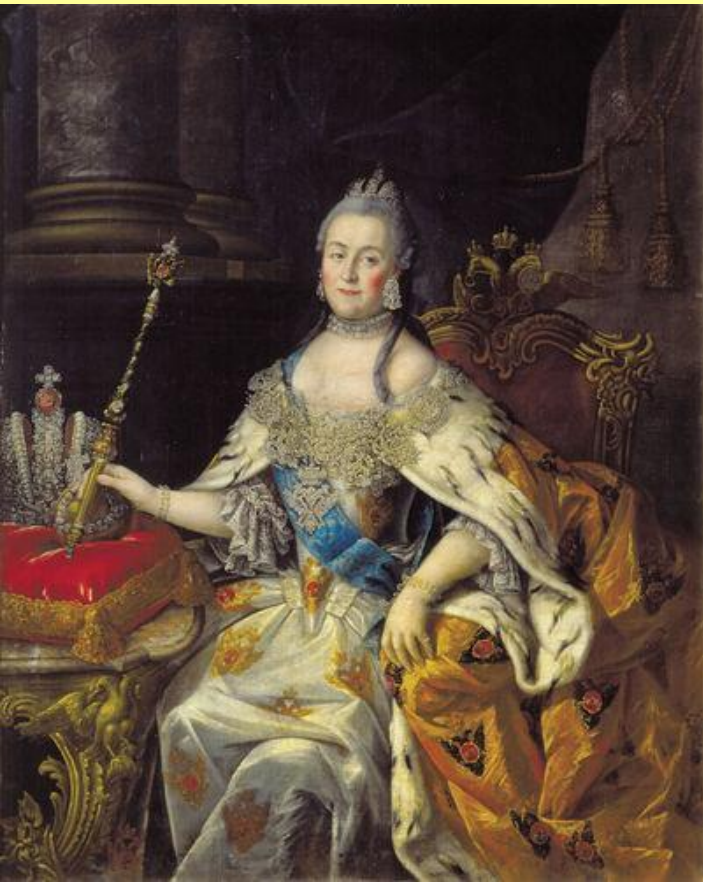
Портрет Екатерины II. Худ. А.П. Антропов. 1766 г.

Екатерина вела постоянную переписку с французскими философами: Вольтером, Дидро, д'Аламбером. Вдохновленная их учением, она взялась за решение грандиозной задачи, которую не сумели решить ни Петр, ни Елизавета: составление нового Уложения.