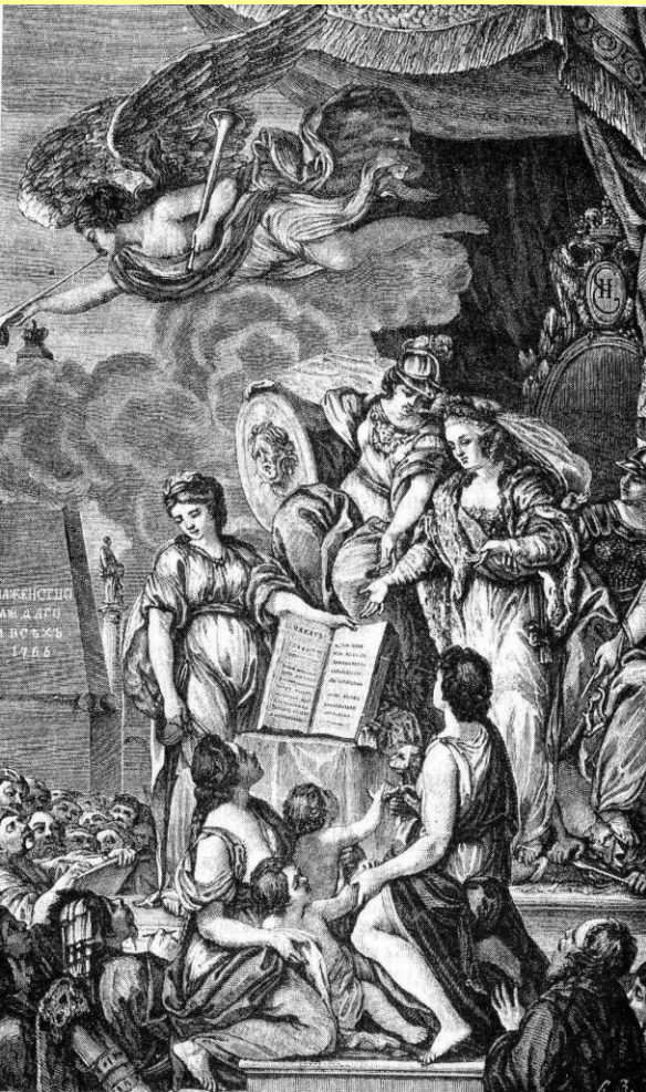
Аллегория на издание «Наказа» Екатерины II.

«Приложить должно более старания к тому, чтобы вселить узаконениями добрые нравы в граждан, нежели привести дух их в уныние казнями».