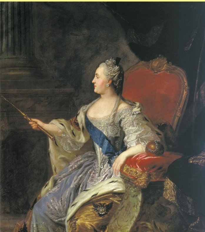
Портрет Екатерины II. Худ. Ф.С. Рокотов. 1767 г.

Екатерина II, по-видимому, считала, что без законодательного смягчения крепостного права и без провозглашения сословных прав (не привилегий!) остального населения новое Уложение окажется бесполезным, а то и вредным.