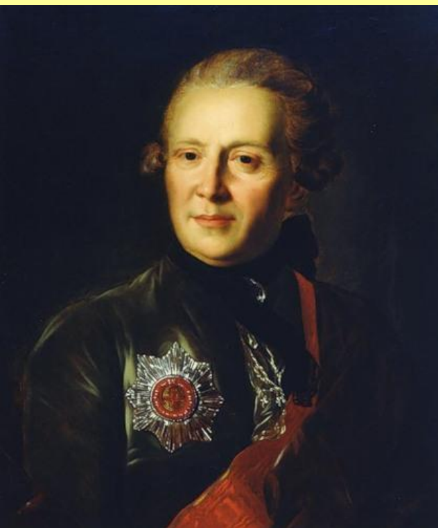
А.П. Сумароков, поэт и драматург. Худ. Ф.С. Рокотов.

О том же говорят и возражения А.П. Сумарокова на «Наказ»: «Сделать русских крепостных людей вольными нельзя... Будет ужасное несогласие между помещиков и крестьян, непрестанная будет в государстве междоусобная брань, вместо того, что ныне помещики живут покойно в вотчинах, отчины их превратятся в опаснейшие им жилища, ибо они будут зависеть от крестьян, а не крестьяне от них».