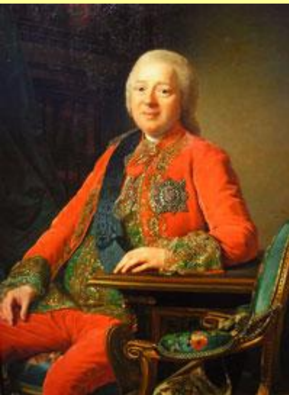
Никита Иванович Панин. Худ. А. Рослин.

Панин подал проект создания Императорского совета из 7–8 сановников, облеченных доверием монарха, который и должен был управлять страной.