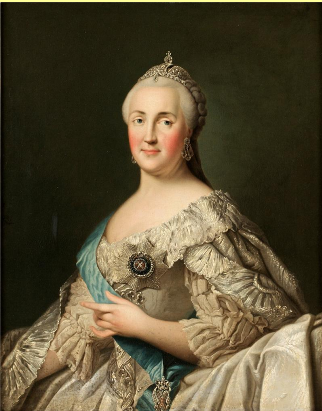
Екатерина Великая. Худ. В. Эриксен.