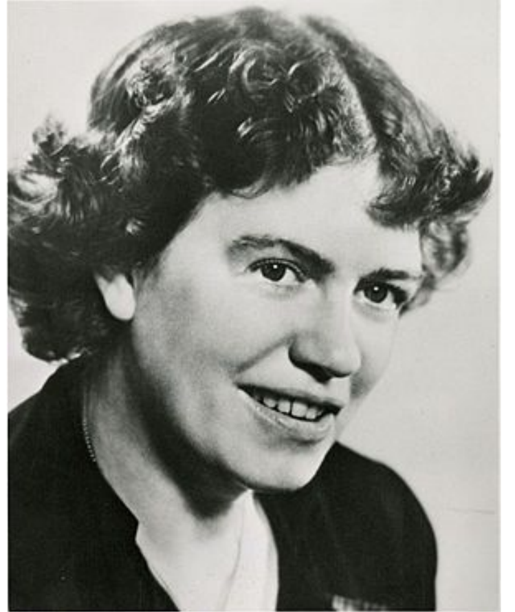
Маргарет Мид - американский антрополог, соц. психолог и этнограф.

В 60-е гг. XX века Маргарет Мид, среди прочих специалистов, обосновала взаимосвязь изменений в культуре общества с изменением типа межпоколенных отношений .