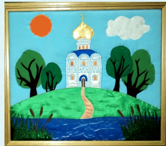
Дорога к храму

5 класс «Народные мотивы в современном фартуке»