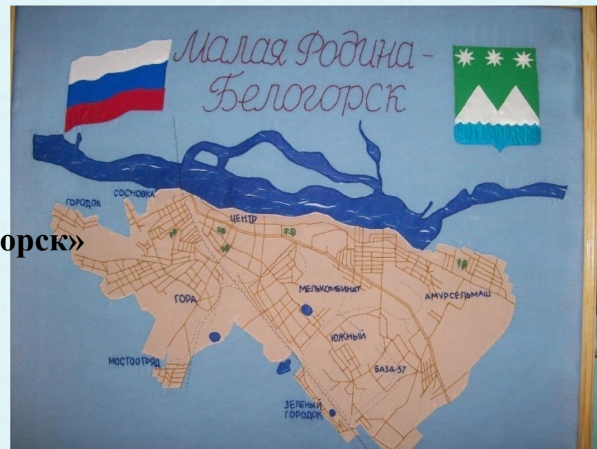
«Моя малая Родина – Белогорск»