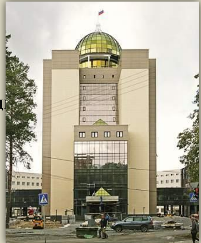
Новый корпус НГУ