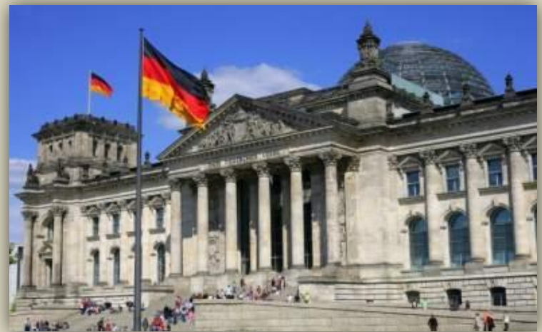
Здание федерального правительства Германии