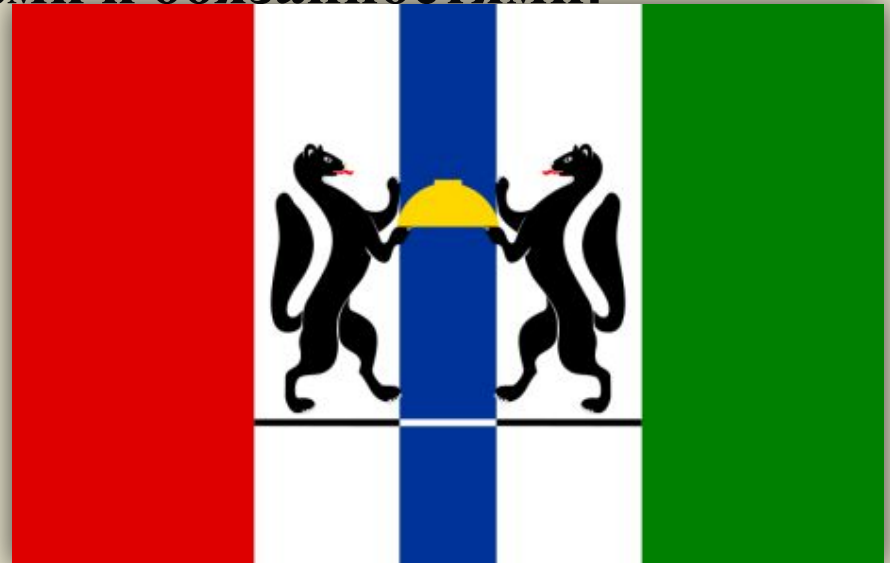
Флаг Новосибирской области