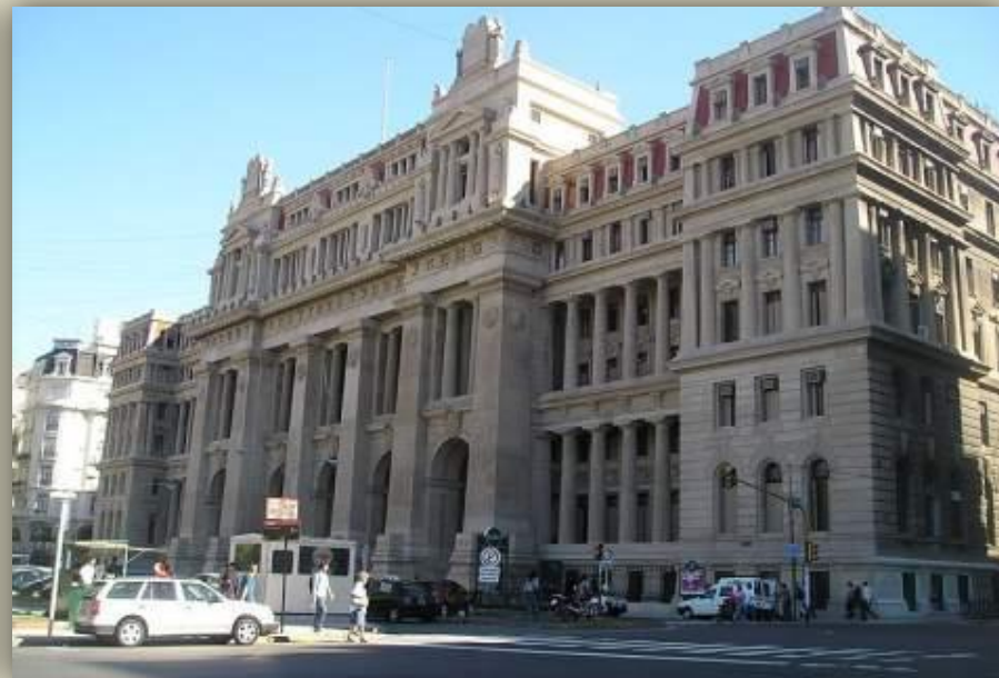
Здание Верховного суда Аргентина