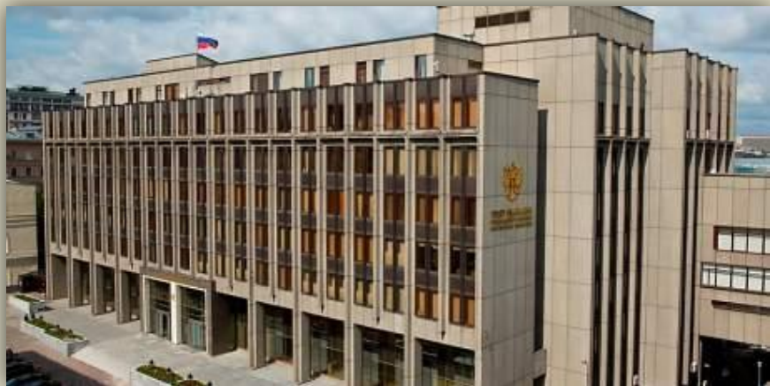
Здание Совета Федерации