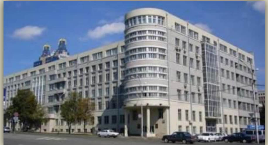
Администрации Новосибирской обл.