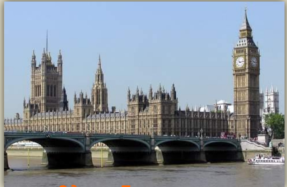
Здание Британского парламента (Вестминстерский дворец)