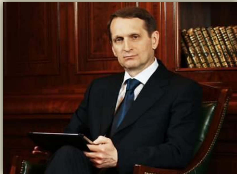
Председатель ГД Сергей Нарышкин, Единая Россия (с 21 дек. 2011 г.)