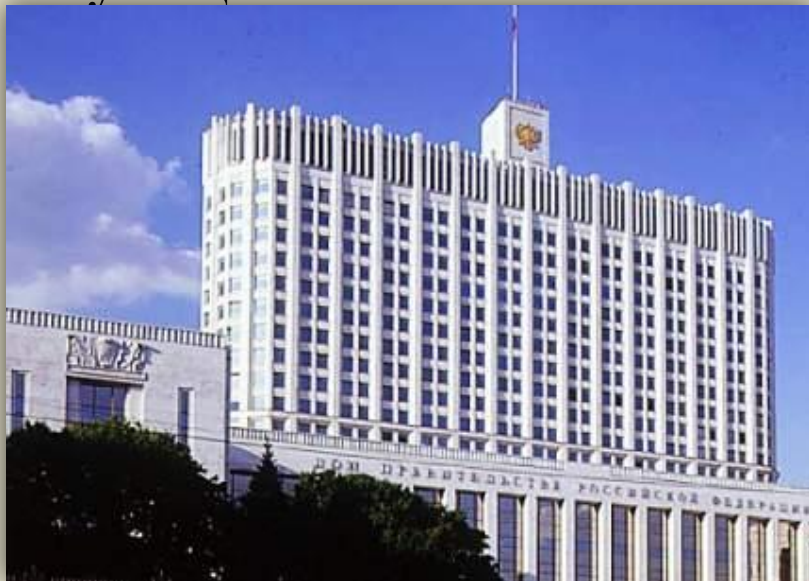
Здание Правительства РФ