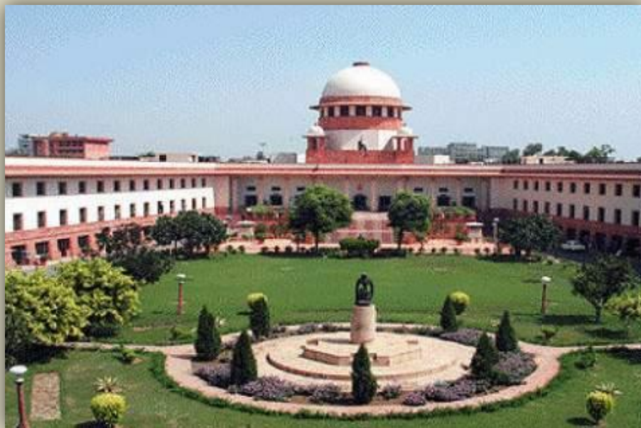
Здание Верховного суда Индия

Органы судебной власти от имени государства применяют меры административного или уголовного принуждения к лицам, виновным в совершении правонарушения, разрешают правовые споры.