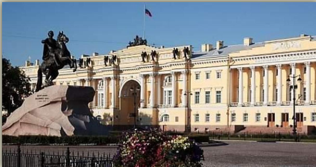
Конституционный суд РФ Санкт-Петербург