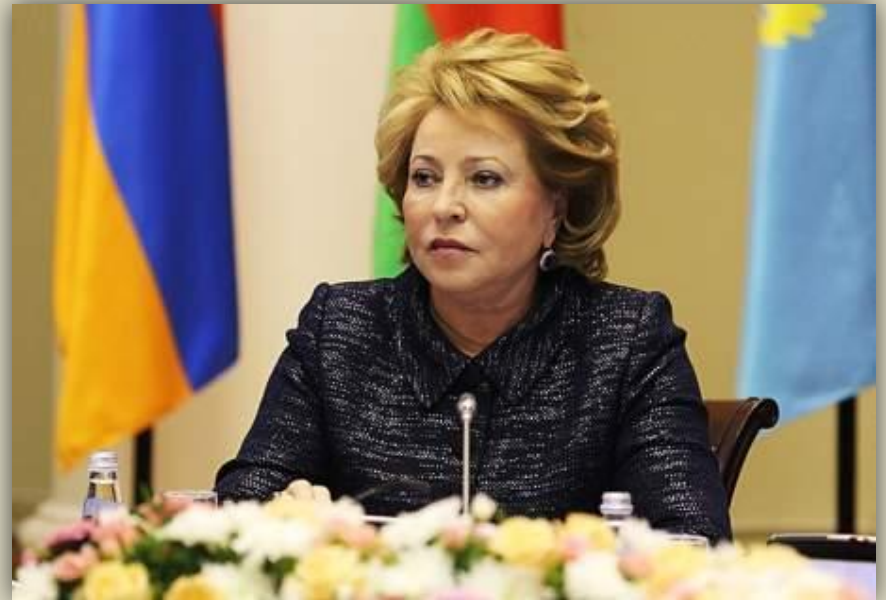
Председатель СФ Валентина Матвиенко (с 21 сент. 2011 г.)