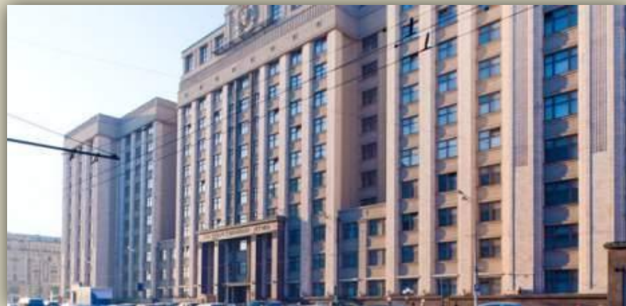
Здание Государственной Думы