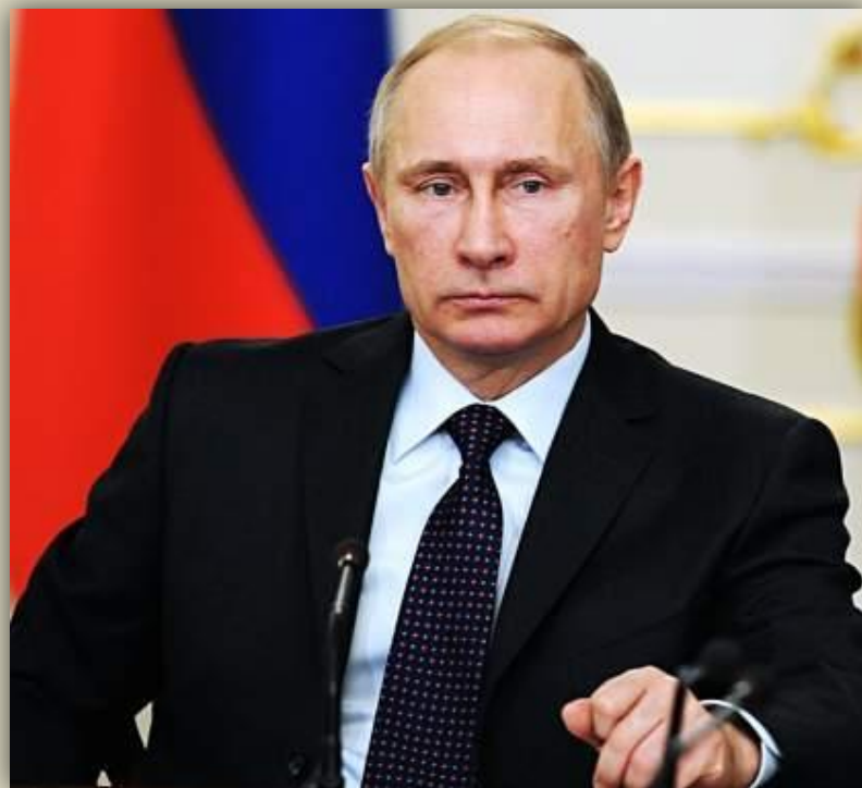
Президент РФ В.В. Путин (с 4 марта. 2012 г.)