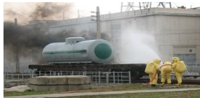
Civilā drošība un aizsardzība