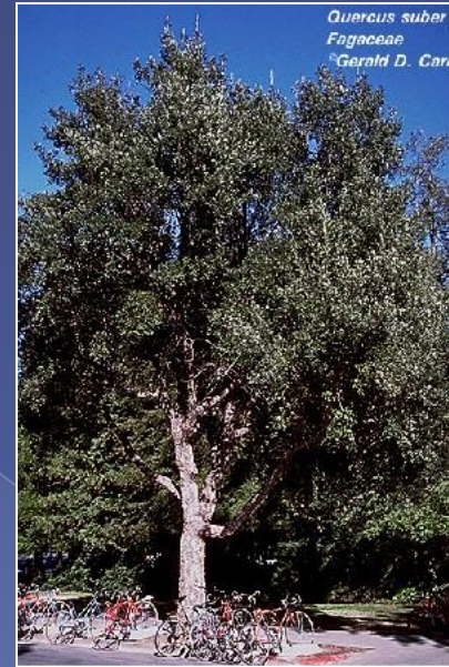
Quercus suber Fagaceae Gerald D. Carr