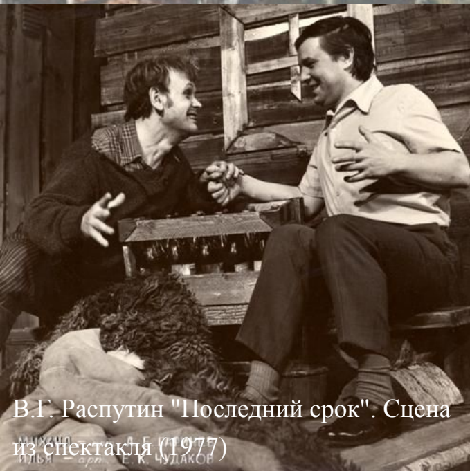
В.Г. Распутин "Последний срок". Сцена

Его бойкость и говорливость выдают натуру суетную и неглубокую, торопящуюся со всем согласиться, ко всему приноровиться, лишь бы себе не в убыток, так он катится весёлым колобочком по жизни