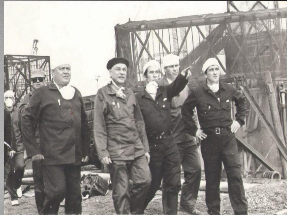
Группа ликвидаторов. Фото на память

Нужно отметить, что, учитывая запредельную мощь такого крупного механизма, как ЧАЭС, остановить работу станции в один миг было просто невозможно. Поэтому станция осуществляла выработку энергии до начала нового века, а если более конкретно, то до 2000 года. Несмотря на это атомная станция остается в том же правовом поле и, продолжая носить статус ядерного объекта, требует надежной защиты.