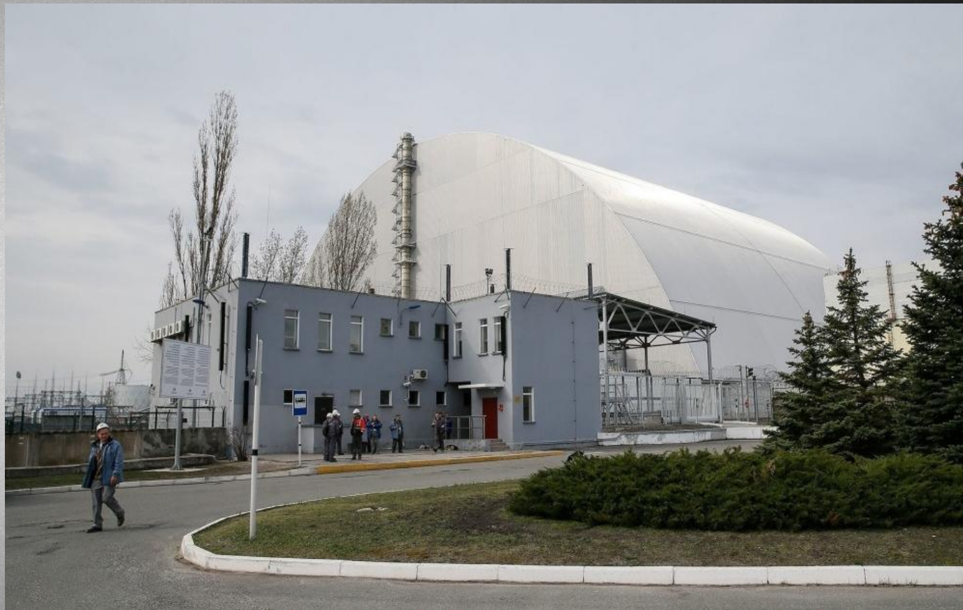
ЧАЭС в 2017 году