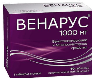
Схема приема: Рекомендуемая доза при венозно-лимфатической недостаточности

Терапия симптомов венозно-лимфатической недостаточности: судороги нижних конечностей; ощущение тяжести и распираия в ногах; боль; «усталость» ног. Терапия проявлений венозно-лимфатической недостаточности: отеки нижних конечностей; трофические изменения кожи и подкожной клетчатки; венозные трофические язвы. Симптоматическая терапия острого и хронического геморроя.