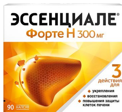
Схема приема: Внутрь. Капсулы следует проглатывать целиком, запивая достаточным количеством воды (примерно 1 стакан). Для подростков старше 12 лет и взрослых рекомендуется принимать по 2 капсулы - 3 раза в день во время еды. Рекомендованный курс терапии – 3 месяца. Курс может быть индивидуально определен врачом. Более подробная информация - см. инструкцию.

Показания к применению: Хронические гепатиты, цирроз печени, жировая дистрофия печени различной этиологии, токсические поражения печени, алкогольный гепатит, нарушения функции печени при других соматических заболеваниях. Токсикоз беременности. Профилактика рецидивов образования желчных камней. Псориаз (в качестве средства вспомогательной терапии). Радиационный синдром.