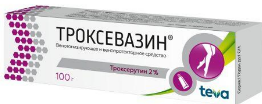
Схема приема: Наружно. Гель наносят на область поражения 2 раза/сут утром и вечером, мягко втирая до полного впитывания. При необходимости гель можно наносить под бинты или эластичные чулки. Успех лечения препаратом в большой степени зависит от его регулярного применения в течение длительного времени.

Варикозное расширение вен ног; Хроническая венозная недостаточность с такими проявлениями, как: отеки, боль, ощущение тяжести в ногах; Поверхностный тромбофлебит, перифлебит, флеботромбоз; Посттромботический синдром; Посттромботический отек, гематомы; Профилактика осложнений после операций на венах.