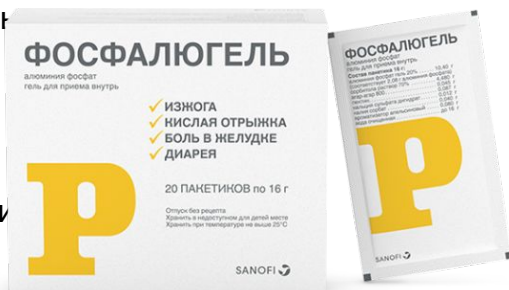
Схема приема: Для взрослых и детей старше 6 лет – прием внутрь по 1-2 пакетика 2-3 раза в сутки. Для детей младше 6 месяцев – 1/4 пакетика или 1 чайная ложка (4 г) после каждого из 6 кормлений; старше 6 месяцев – 1/2 пакетика или 2 чайные ложки после каждого из 4 кормлений. Препарат можно принимать в чистом виде или перед приемом развести в половине стакана воды. Более подробная информация - см. инструкцию.

Показания к применению: язвенная болезнь желудка и двенадцатиперстной кишки; гастрит с нормальной или повышенной секреторной функцией; грыжа пищеводного отверстия диафрагмы; гастроэзофагеальный рефлюкс, рефлюкс-эзофагит в том числе сопровождающийся изжогой, кислой отрыжкой; синдром неязвенной диспепсии; функциональная диарея; функциональные заболевания толстой кишки; желудочные и кишечные расстройства, вызванные интоксикацией, приемом лекарственных препаратов, раздражающих веществ (кислоты, щелочи), алкоголя.