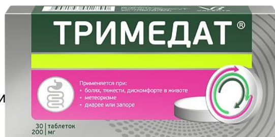
Схема приема: Внутрь. Взрослым и детям с 12 лет: 1 таблетка X 3 раза в сутки.

Симптоматическое лечение боли, спазмов и дискомфорта в области живота, ощущения вздутия (метеоризма), моторных расстройств кишечника с изменением частоты стула (диарея или запор), диспепсии, изжоги, отрыжки, тошноты, рвоты, связанных с функциональными заболеваниями органов ЖКТ и желчных путей (неэрозивная форма гастроэзофагеальной рефлюксной болезни; желчнокаменная болезнь; дисфункция желчевыводящих путей; синдром раздраженного кишечника; дисфункция сфинктера Одди, постхолецистэктомический синдром).