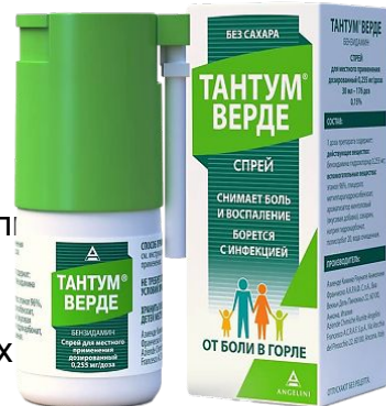
Схема приема: Местно, после еды. Одна доза (одно впрыскивание) соответствует 0,255 мг бензидамина. Взрослым (в т.ч. больным пожилого возраста) и детям старше 12 лет – по 4-8 впрыскиваний 2-6 раз в сутки. Детям от 6 до 12 лет – по 4 впрыскивания 2-6 раз в день. Детям от 3 до 6 лет - по 1 впрыскиванию на каждые 4 кг массы тела, но не более 4 впрыскиваний (максимальная разовая доза) 2 - 6 раз в день. Более подробная информация - см. инструкцию.

Показания к применению: Симптоматическая терапия болевого синдрома воспалительных заболеваний полости рта и ЛОР-органов (различной этиологии): гингивит, глоссит, стоматит (в т.ч. после лучевой и химиотерапии); фарингит, ларингит, тонзиллит; кандидоз слизистой оболочки полости рта (в составе комбинированной терапии); калькулезное воспаление слюнных желез; после оперативных вмешательств и травм (тонзиллэктомия, переломы челюсти); после лечения и удаления зубов; пародонтоз;