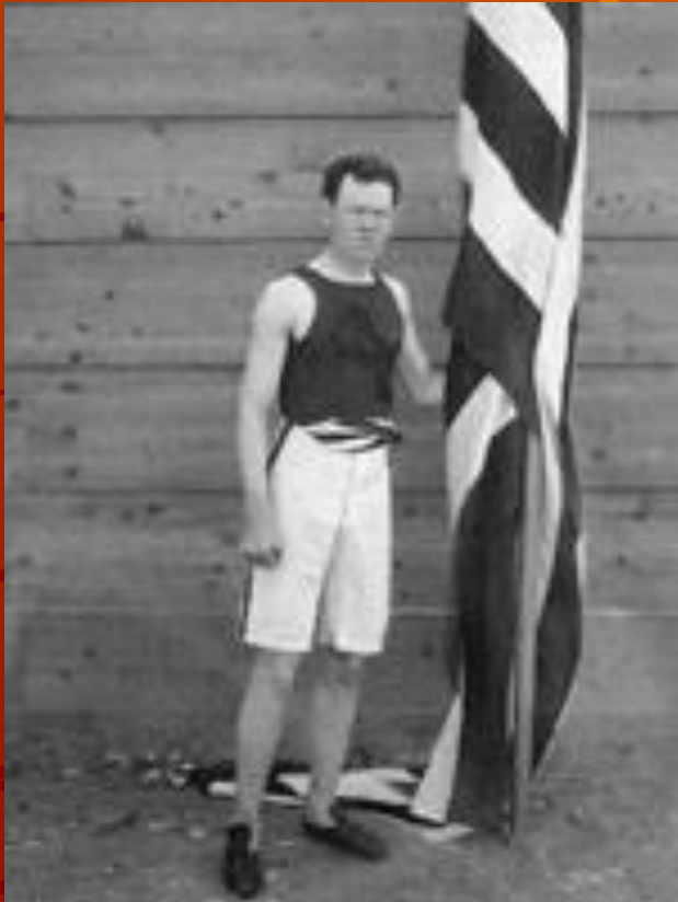
Джеймс Конноли. Первый чемпион в истории новых Олимпийских Игр

Первые Игры современности прошли с большим успехом. Несмотря на то, что участие в Играх приняли всего 241 атлет (14 стран), Игры стали крупнейшим спортивным событием, прошедшим когда-либо со времён Древней Греции.