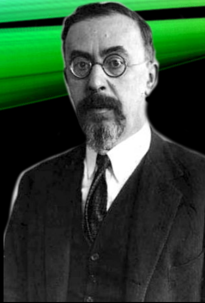
Семён Людвигович Франк