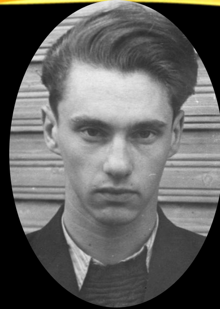
Давид Вениаминович Ривман

В нашей стране первые виктимологические разработки относятся к середине 60-х гг. В числе отечественных основоположников виктимологии, думаем, справедливо будет назвать Л. В. Франка и Д.В. Ривмана . Именно в их трудах впервые исследовались важные аспекты личности жертвы преступления и ее роли в механизме преступного поведения. В дальнейшем советские ученые изучают в рамках единого проблемного комплекса личность и поведение жертвы в ситуации преступных посягательств; ее роль в генезисе преступления; криминологически значимые отношения и связи между жертвой и преступником; пути и способы возмещения или сглаживания вреда, нанесенного жертве в результате преступного посягательства. При этом внимание исследователей особенно привлекают количественные и качественные статистически значимые характеристики криминальной виктимизации.