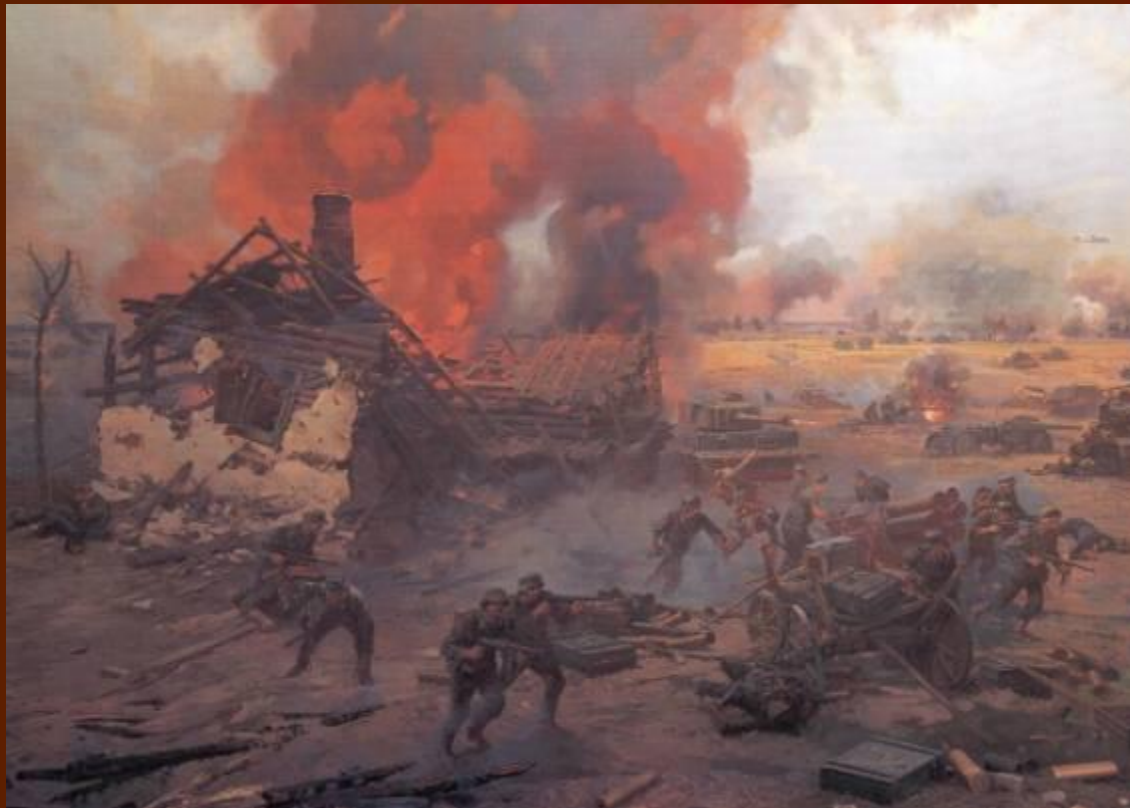
Курская битва (фрагмент диорамы). Присекин Н.С. 1995 г.

« В привычных сумерках суровых Полночным залпам торжества, Рукоплеща победе новой, Внимала древняя Москва. И голос праздничных орудий В сердцах взволнованных людей Был отголоском грозных буден, Был громом ваших батарей. И каждый дом и переулок, И каждым камнем вся Москва Распознавала в этих гулах- ОРЕЛ и БЕЛГОРОД- слова.» (А. Твардовский)