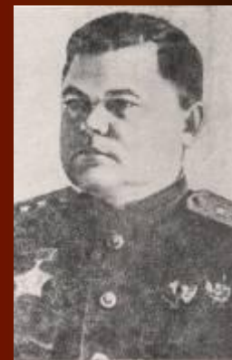
Н.Ф. Ватутин, командующий Воронежским фронтом