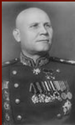
Конеv И. С., командующий Степным фронтом