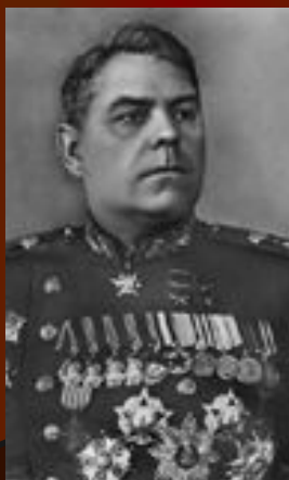
Василевский А.М., представитель Ставки