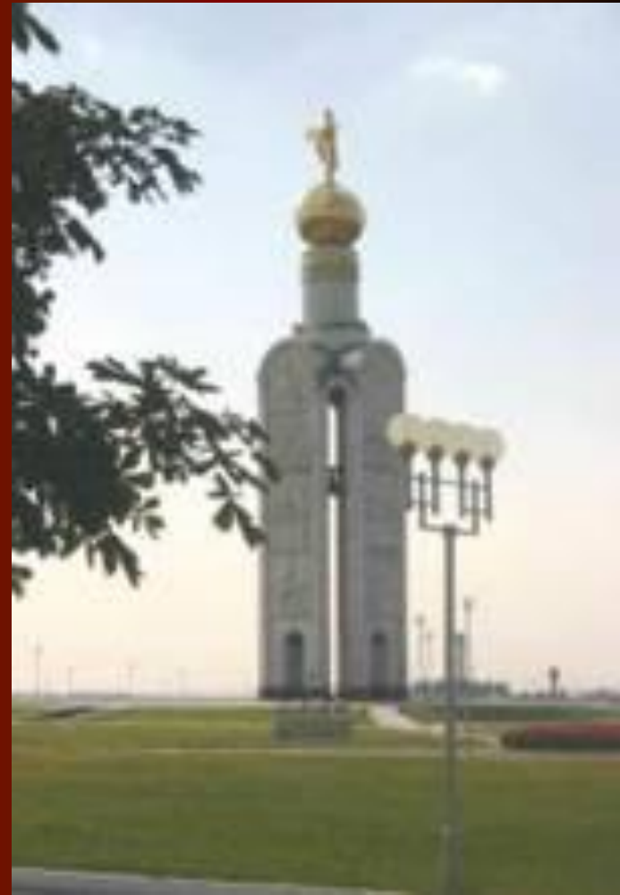
Памятник сражению под Прохоровкой

«Всё дальше от нас Грозные военные годы, Сегодня они- В обелисках и в звонких строках. На все времена Героический подвиг народа Останется жить В благородных и честных сердцах.» (Т. Дунаевская)