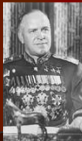
Жуков Г.К. представитель Ставки