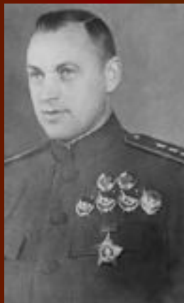
Рокоссовский К.К., командующий Центральным фронтом