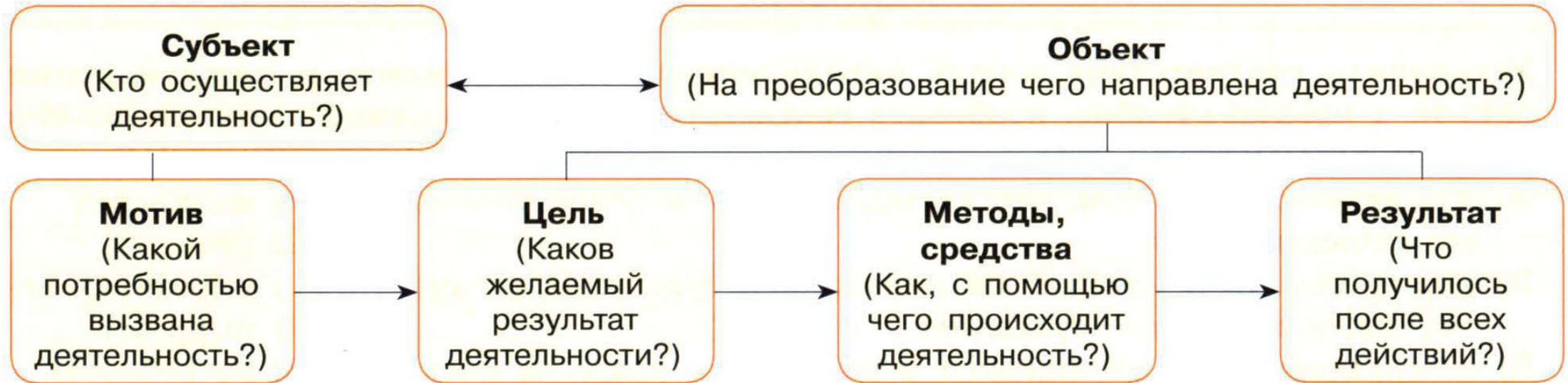
Схема из «Модульного триактив-курса» Котовой и Лисковой