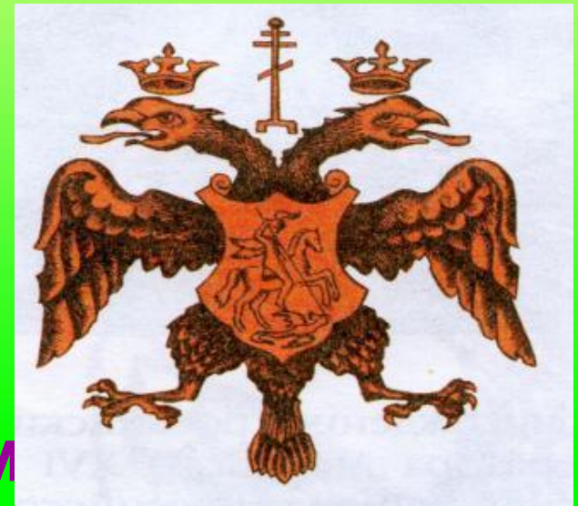
Герб в середине 16 в