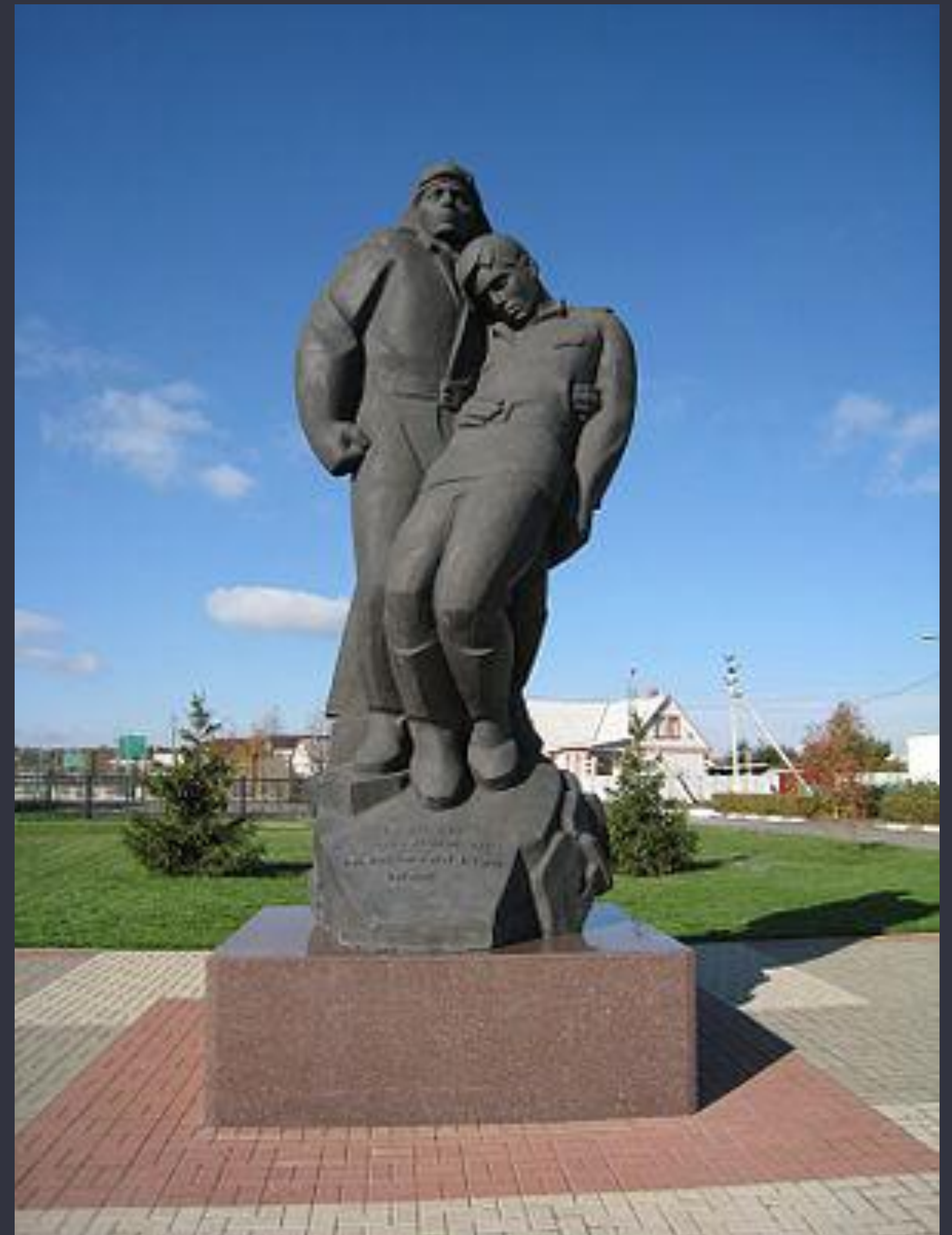
Памятник павшим воинам в мемориальном комплексе «Прохоровское поле»

Непосредственное командование танковыми соединениями во время сражения осуществляли: генерал-лейтенант танковых войск Павел Ротмистров с советской стороны и обергруппенфюрер СС Пауль Хауссер со стороны Германии. Ни одной из сторон не удалось достичь целей, поставленных на 12 июля: германским войскам не удалось захватить Прохоровку, прорвать оборону советских войск и выйти на оперативный простор, а советским войскам не удалось окружить группировку противника.