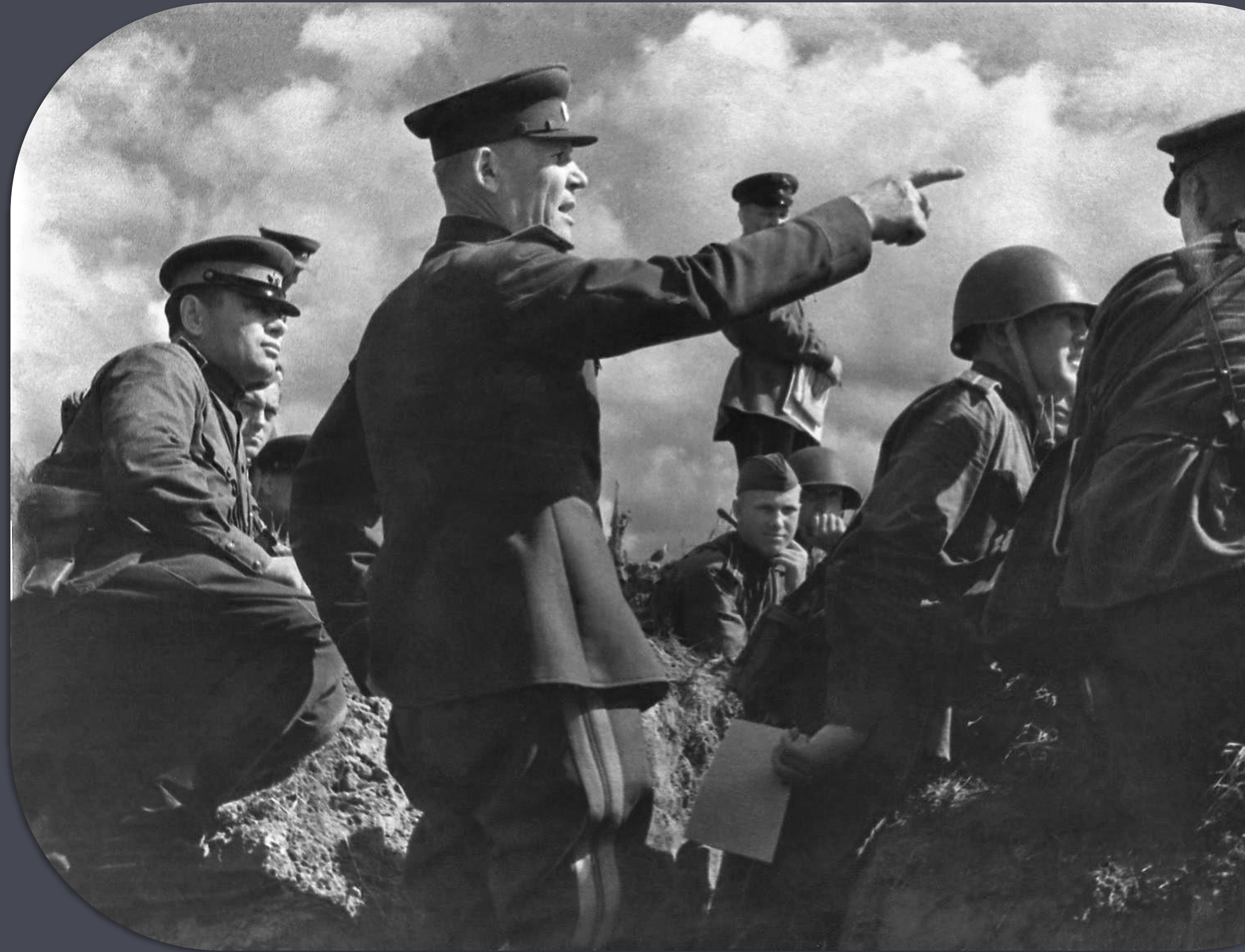
Командующий Степным фронтом генерал-полковник И. С. Конев. Август. 1943

Советское командование планировало частью своих сил (войсками смежных крыльев Воронежского и Степного фронтов) нанести удар по врагу из района северо-западнее Белгорода в направлении на Богодухов, Валки Новую Водолагу, при этом раскалывая немецкую группировку войск на части, после чего предполагалось перекрыть путь отхода от Харькова на запад и юго-запад. Второй удар предполагался силами 27-й, 40-й армии и тремя танковыми корпусами на Ахтырку с целью изолировать Харьков от резервов противника для помощи главным силам. Расстояние до Центрального фронта прикрывалось 38-й армией. 57-я армия Юго-Западного фронта наступала к югу от Харькова, чтобы не дать противнику уйти. Планировалось провести операцию в 2 этапа: на первом — провести наступление севернее, восточнее и южнее Харькова, а на втором — освободить сам Харьков.