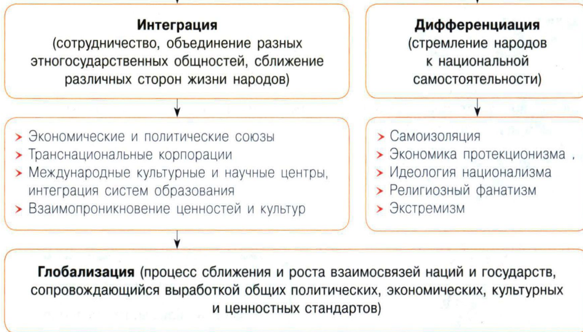
Схема из «Модульного триактив-курса» Котовой и Лисковой