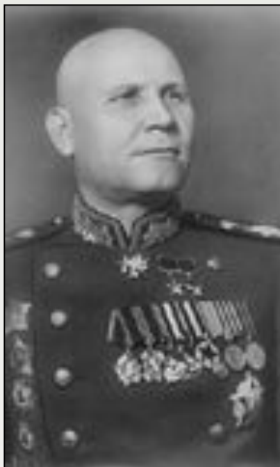
Конев И. С., командующий Степным фронтом