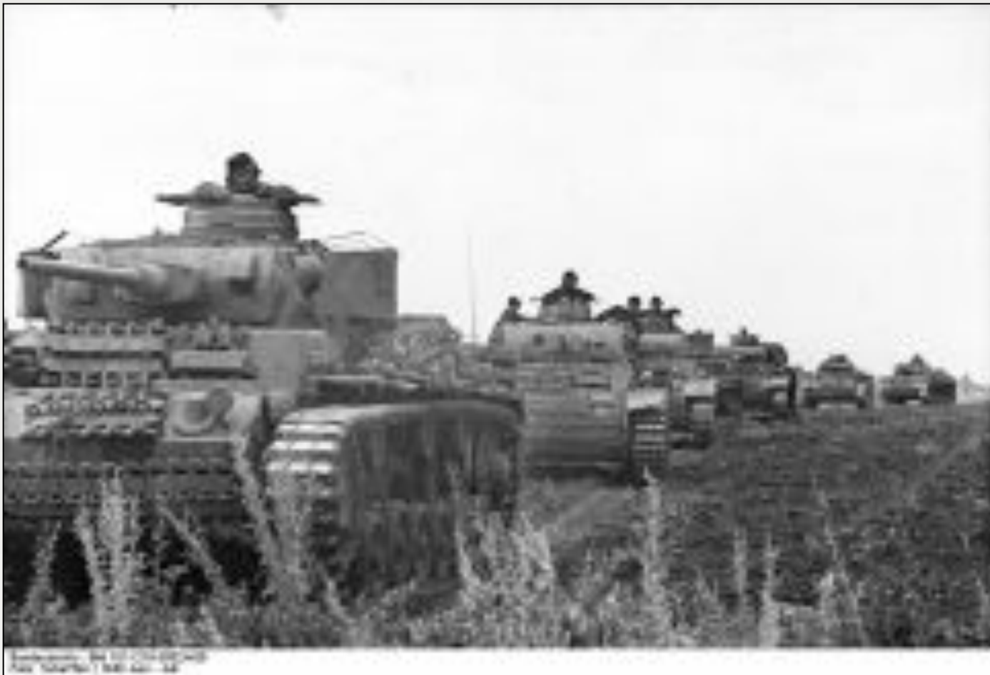
Музей истории Вооруженных Сил Российской Федерации