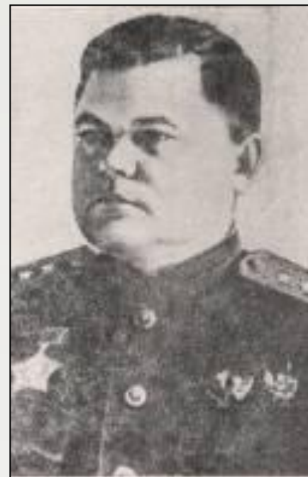
Н.Ф. Ватутин, командующий Воронежским фронтом