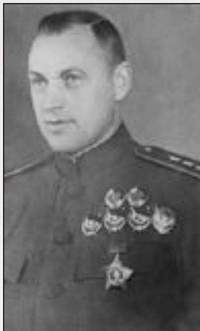
Рокоссовский К.К., командующий Центральным фронтом