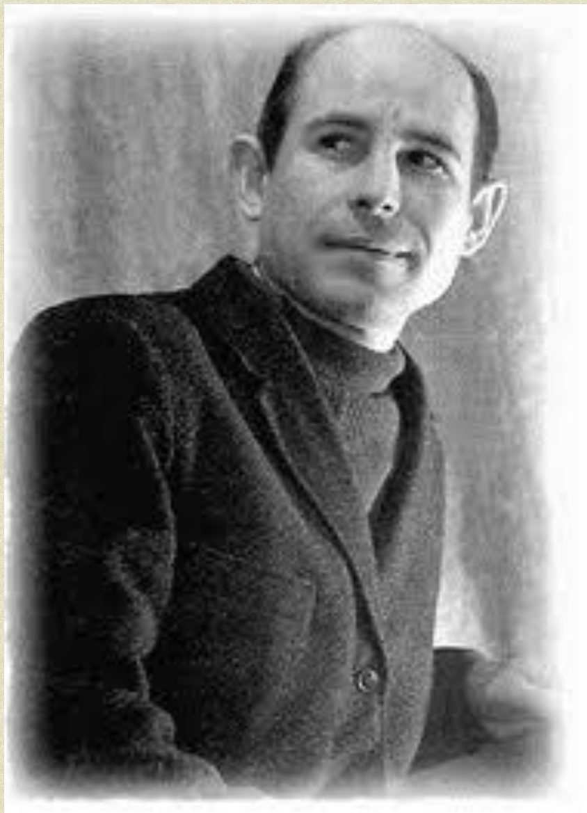
Николай Михайлович Рубцов (1936-1971)