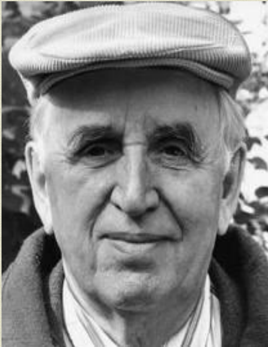
Виктор Фёдорович Боков (1914-2009)