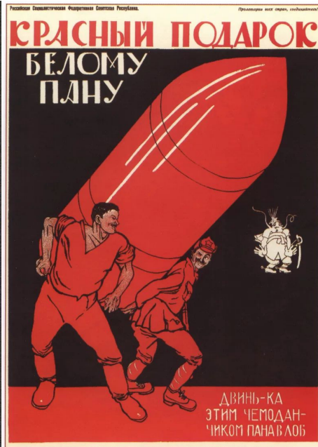
60. Моор Д. Красный подарок белому пану... 1920