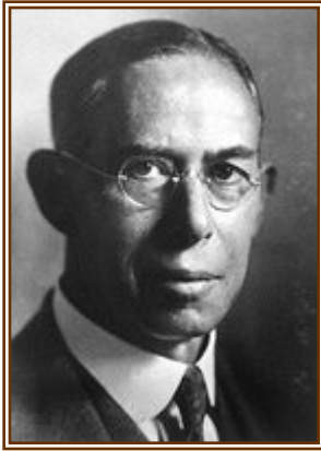
Джозеф Эрлангер (Joseph Erlanger, 1874–1965)