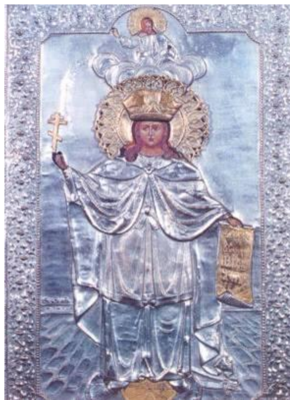
Иконы Святой Великомученицы Екатерины