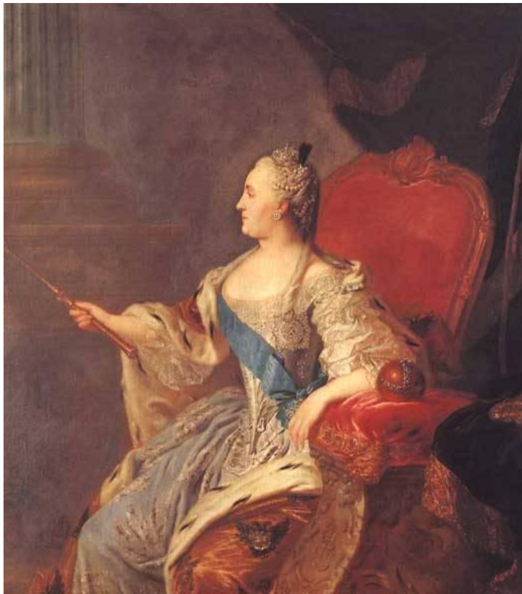
Портрет Екатерины Второй, 1763 г., Ф. Рокотов