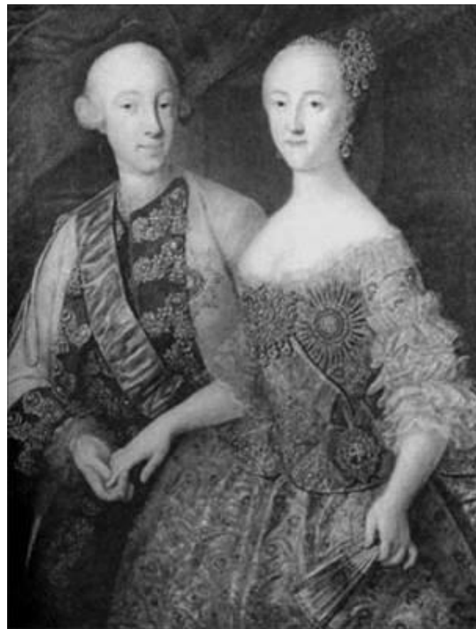
Великий князь Петр Федорович и Великая княгиня Екатерина Алексеевна