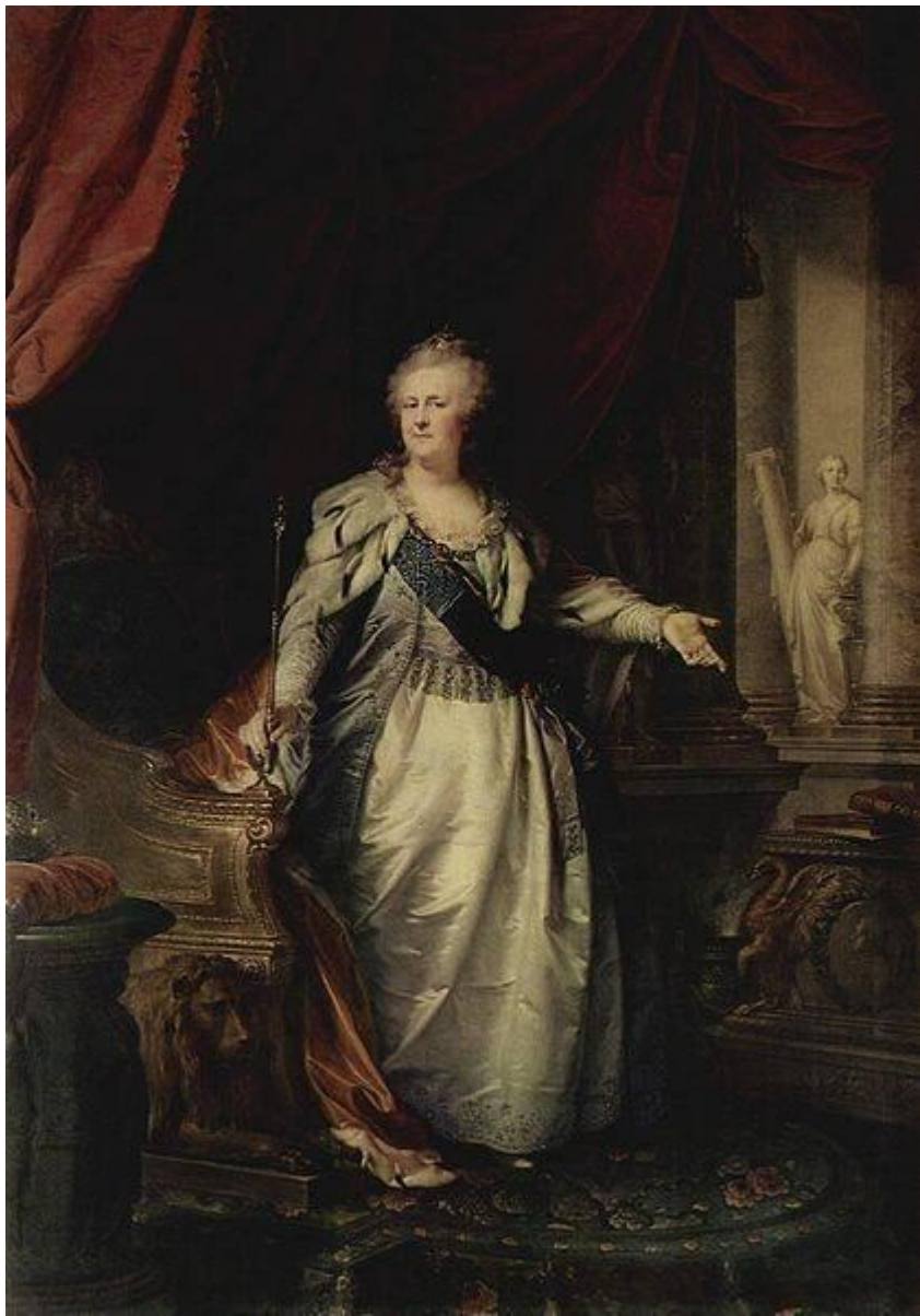
Портрет работы Лампи, 1793 г.