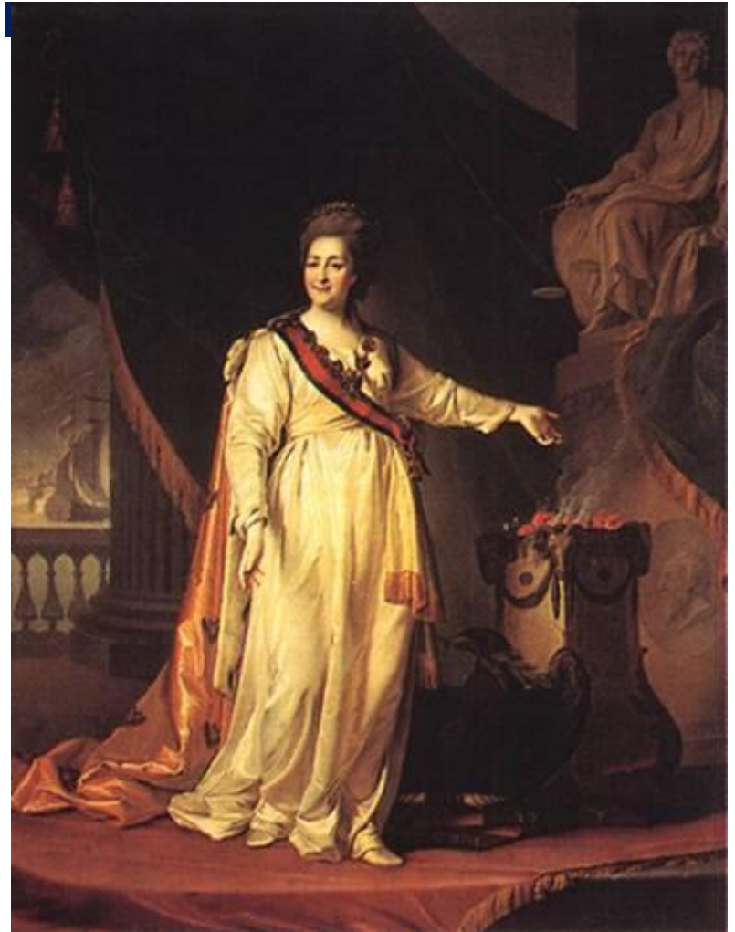
Д.Г. Левицкий портрет Екатерины II в храме богини правосудия,