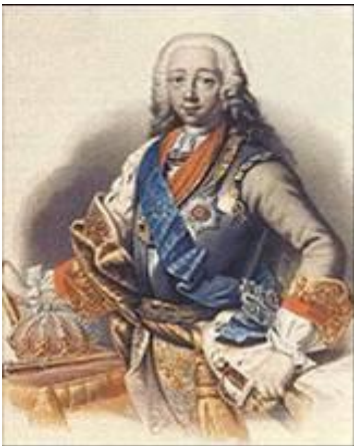
Великий князь Петр Федорович будущий император Петр III