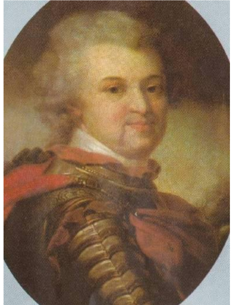
КНЯЗЬ Г. А. ПОТЕМКИН-ТАВРИЧЕСКИЙ

В 1787 году по приказу Потёмкина из бывших запорожских казаков стали набирать команды. Их назвали Войском верных казаков .За успехи в войне 1788 года Войско верных казаков получило название «Черноморское».