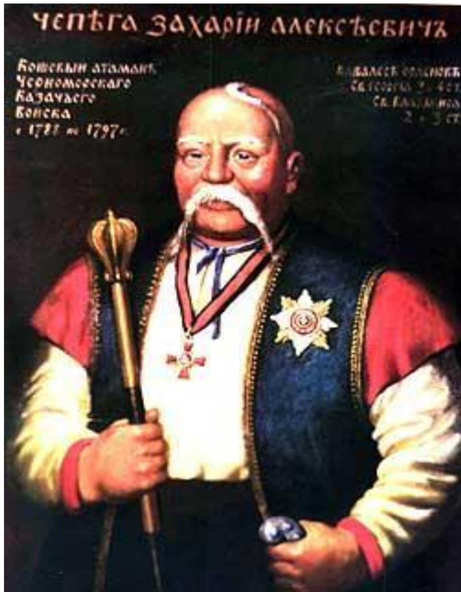
ЗАХАРІЙ АЛЕКСЕЕВИЧ ЧЕПЕГА