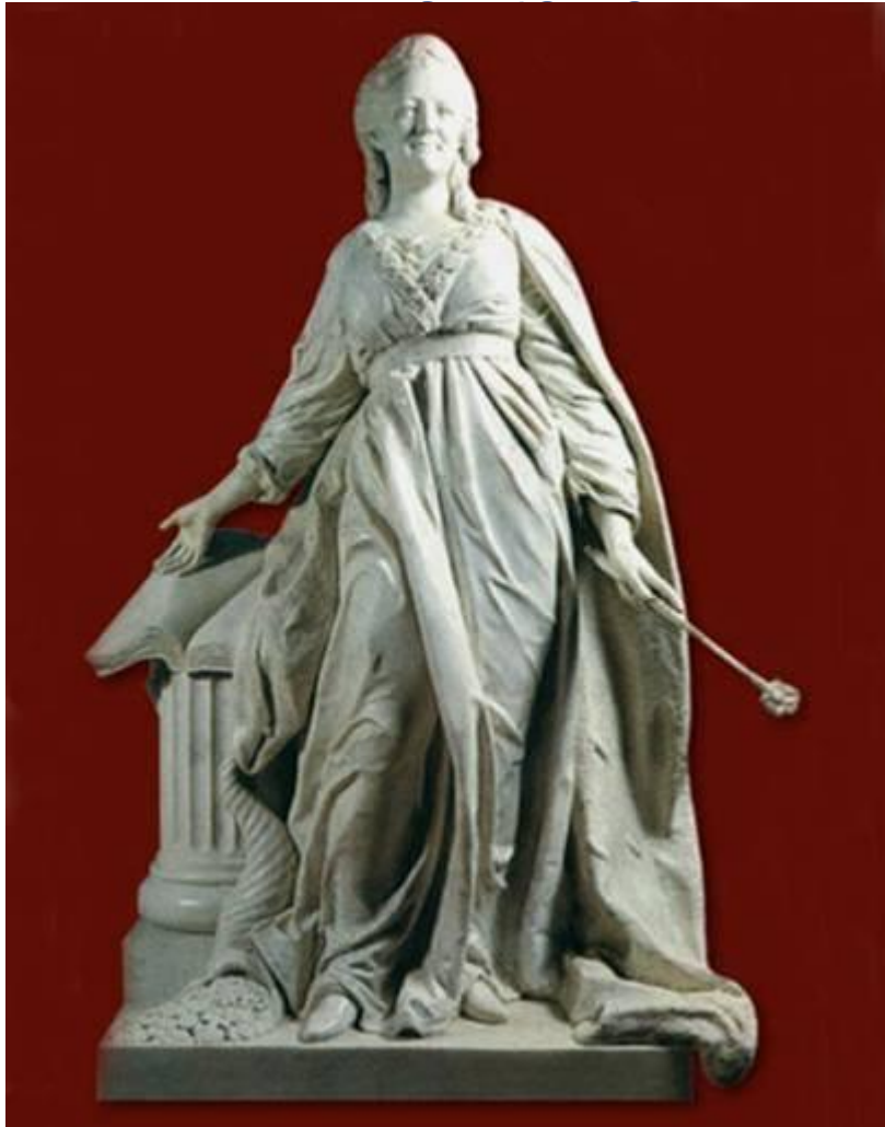
Ф.И.Шубин, скульптура 1789-1790 гг.