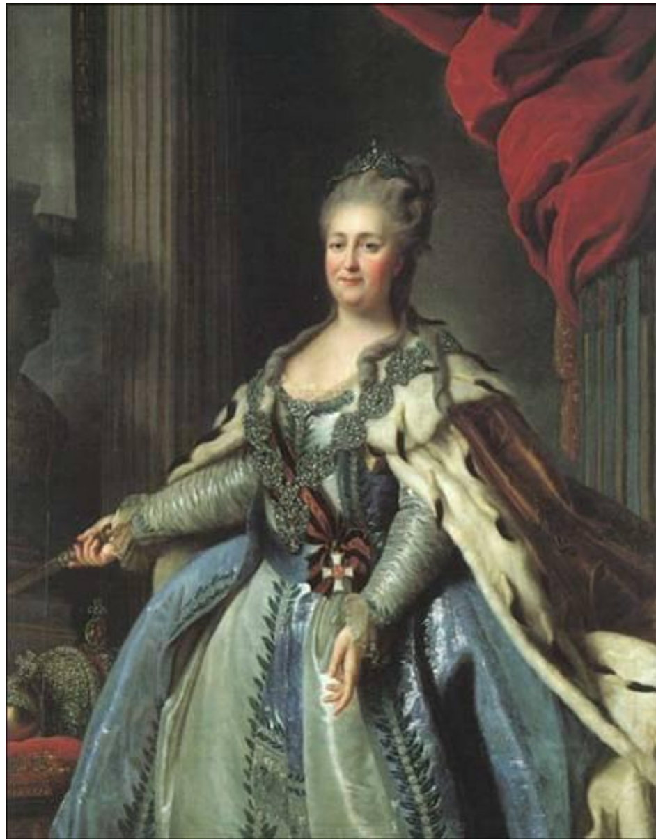
Фрагмент картины Ф. Рокотова, 1770 г.