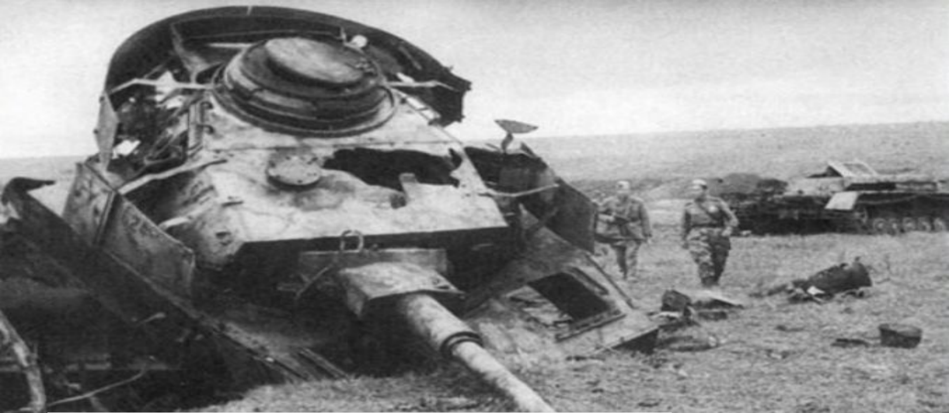
Битва под Курском. Фото подбитого “Тигра”