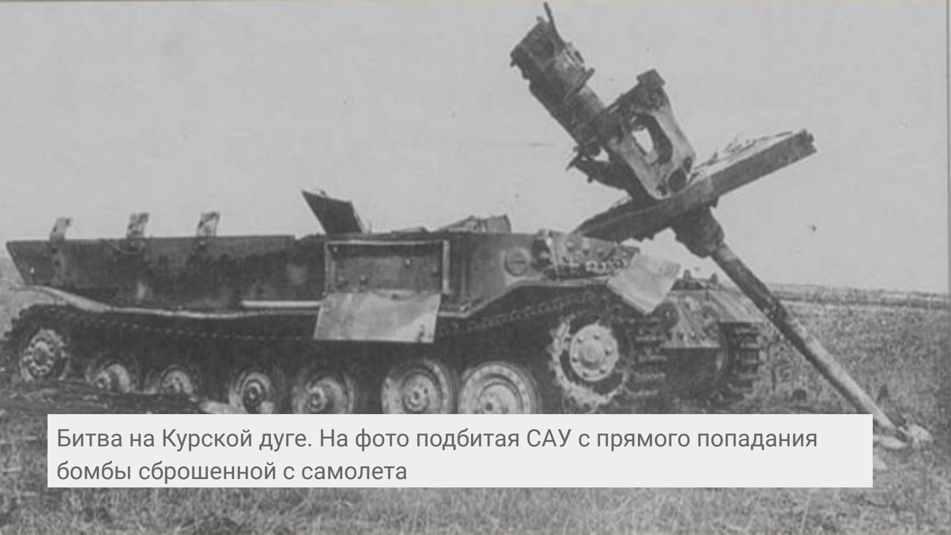
Битва на Курской дуге. На фото подбитая САУ с прямого попадания бомбы сброшенной с самолета