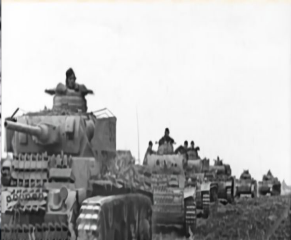
Фото немецких танков и солдат перед началом Курской битвы