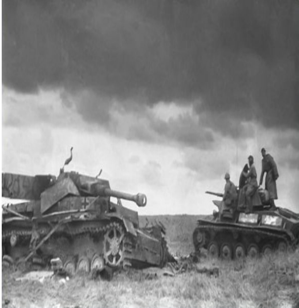
Фото русского танка на фоне подбитого "Тигра"