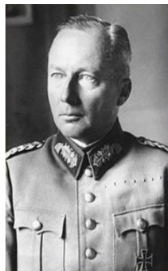
Ханс фон Клюге