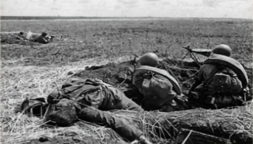
Фото битвы на Курской дуге

Сверху советские солдаты ведут бой из немецкого окопа, снизу атака русских солдат