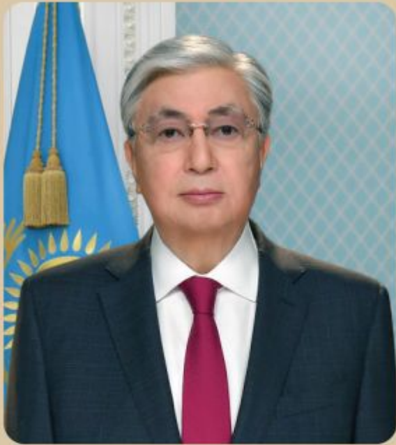
Мемлекет басшысы Қасым-Жомарт Тоқаевтың Ұлттық құрылтайдың «Әділетті Қазақстан – Адал азамат» атты екінші отырысында сөйлеген сөзінен үзінді

...Біз ұлттық бірегейлігімізді нығайтуымыз қажет. Ұлтымыздың бірегейлігі бұл – оның табысты болуы деген сөз. Адал азаматқа тән қасиеттер әрбір жастың бойынан табылуы керек. Ұлттың жаңа болмысы білім, ғылым және мәдениет саласын дамыту арқылы қалыптасады. Осы үш бағытты рухани даму саласындағы жұмыстың мызғымас үштағаны деуге болады. Біз ұрпақ тәрбиесіне баса мән беріп, жастарды жақсылыққа жетелеуіміз керек. Мемлекеттің ең басты байлығы – адам, яғни азаматтар. Әрбір ата-ана саналы ұрпақ өсіруге баса мән беруге тиіс. Сол сияқты мектеп те – білімнің ғана емес, тәлімтәрбиенің ордасы. Баланың бойына біліммен қатар адамгершілік құндылықтарды сіңіру – ұстаздың міндеті. Осыған орай балабақшадағы және мектептегі тәрбие ісіне бәріміз қоғам болып мән беруіміз керек, сондай-ақ белсене атсалысуымыз қажет. Балалар арасында жалпыадамзаттық және ұлттық құндылықтарды дәріптеген абзал. Оқушылар мектеп бітіргенде, ең алдымен, адал азамат болып шығуы керек.